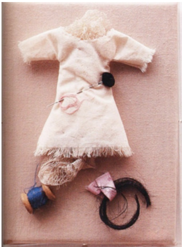
Figura 7. Estela Pereda, Niña cautiva II , 2005. Caja de acrílico que contiene: carretel, hilo, aguja, encaje, vestidito de algodón. 25 x 19 x 3 cm.

el sostenimiento de la casa y las distintas actividades de los integrantes fuera de ella, en la educación sistematizada (hijxs) o el empleo formal del padre. Además, vimos cómo la producción textil es en muchos casos una manifestación del arte popular también y una labor artesanal, vinculada con expresiones artísticas no reconocidas hasta hace poco tiempo.