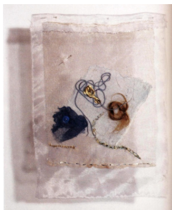
Figura 3. Estela Pereda, 2008. Telas pequeñas y motivos colgantes montados sobre tul. Medidas totales variables según la instalación.

Organza y gaza con pelo, red, botón cinta, cordón. 40x30 cm