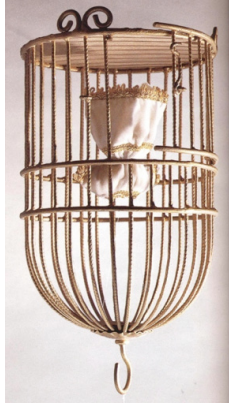
Figura 5. Estela Pereda, La jaula dorada , 2008. Jaula de metal para pájaros y vestido. 45 x 25 cm.