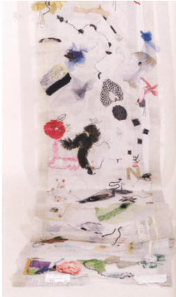
Figura 6. Estela Pereda, Tela participativa 2007. Liencillo con aplicaciones de materiales diversos, bordado, pintura etc. 60 x700 cm.

arte trabaja en la creación de objetos únicos. La artesanía elabora objetos con funciones determinadas, sin embargo, el arte desde la teoría clásica de Kant ha de tener como única función la frucción estética (Kant, 1984). 4