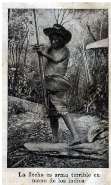
Figura 3: Reproducción de Fotografía ‘Postal indio’.