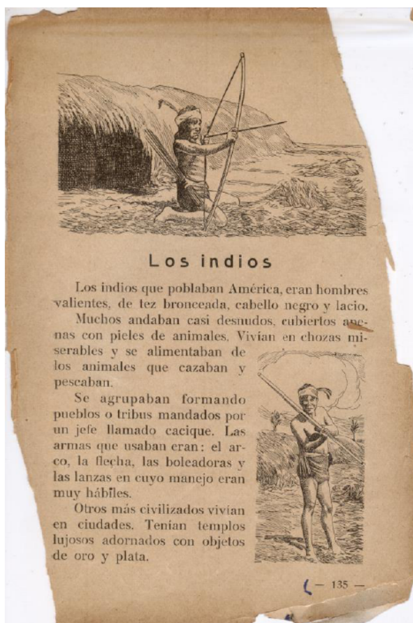
Figura 5: Los indios.

La fotografía postal tuvo “[...] un uso masivo en Buenos Aires y otras ciudades del interior durante los primeros años del siglo XX y los indígenas, tanto del sur como del norte del país, fueron uno de los objetos de representación sobresalientes en las series postales” (Giordano, 2004, p. 89). Autores, autoras y editores echaron mano de este recurso (figura 3). Algunos reemplazaron las postales por grabados que las copiaban, como puede observarse en la figura 5.