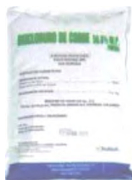
Sólido en Polvo

Insecticida.....Insectos Fungicida.....Hongos Herbicida.....Hierbas Acaricida.....Ácaros Nematicidas.....Nemátodos Molusquicidas.....Moluscos Rodenticidas.....Ratones Bactericidas.....Bacterias