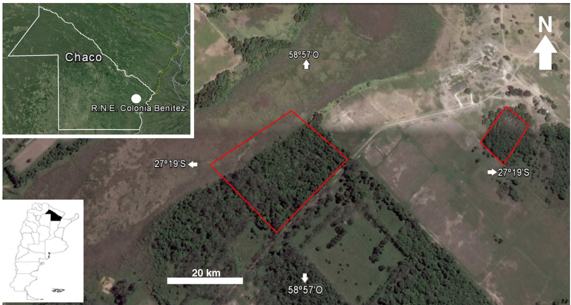
Fig. 1. Ubicación geográfica de la Reserva Natural Educativa Colonia Benítez

quebracho-blanco Schlecht. (quebracho blanco), Caesalpinia paraguariensis (D. Parodi) Burkart (guayacán), Gleditsia amorphoides Griseb. (espina corona), Astronium balansae Engl. (urunday), Diplokeleba floribunda N. E. Br. (ibirá itá), Patagonula americana L. (guayaibí), entre otros (Cabrera, 1971).