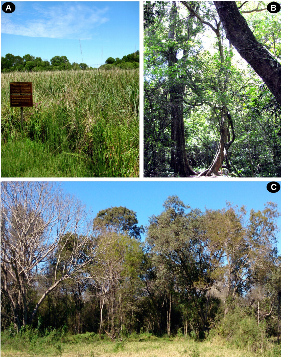
Fig. 2. Ambientes de la Reserva Natural Educativa Colonia Benítez. A: Estero. B: Relicto de selva. C: Quebrachales degradados (C, fotografía gentileza de Nicolás Niveiro).

Con los caracteres diagnósticos se confeccionó una clave dicotómica para la determinación de las especies presentes en la reserva. En el listado de taxones solo se citan dos especímenes representativos, salvo aquellos taxones que poseen un único