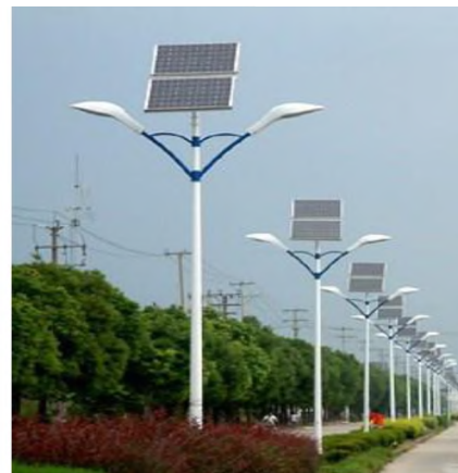
Figura N° 3: Iluminación general de locales con lámparas bajo consumo e iluminación de calles urbanas con lámparas solares.