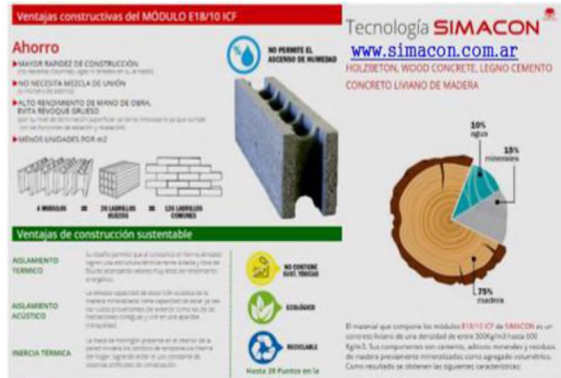
Figura N°2: Sistema constructivo no convencional SIMACOM.

En la elección del equipo de acondicionamiento, luego del análisis exhaustivo de cargas térmicas que recibe el edificio, se opta por equipos actuales que respondan a los criterios de ahorro energético en los consumos eléctricos atendiendo al etiquetado eficiente que rige actualmente para los equipos de consumo eléctrico.