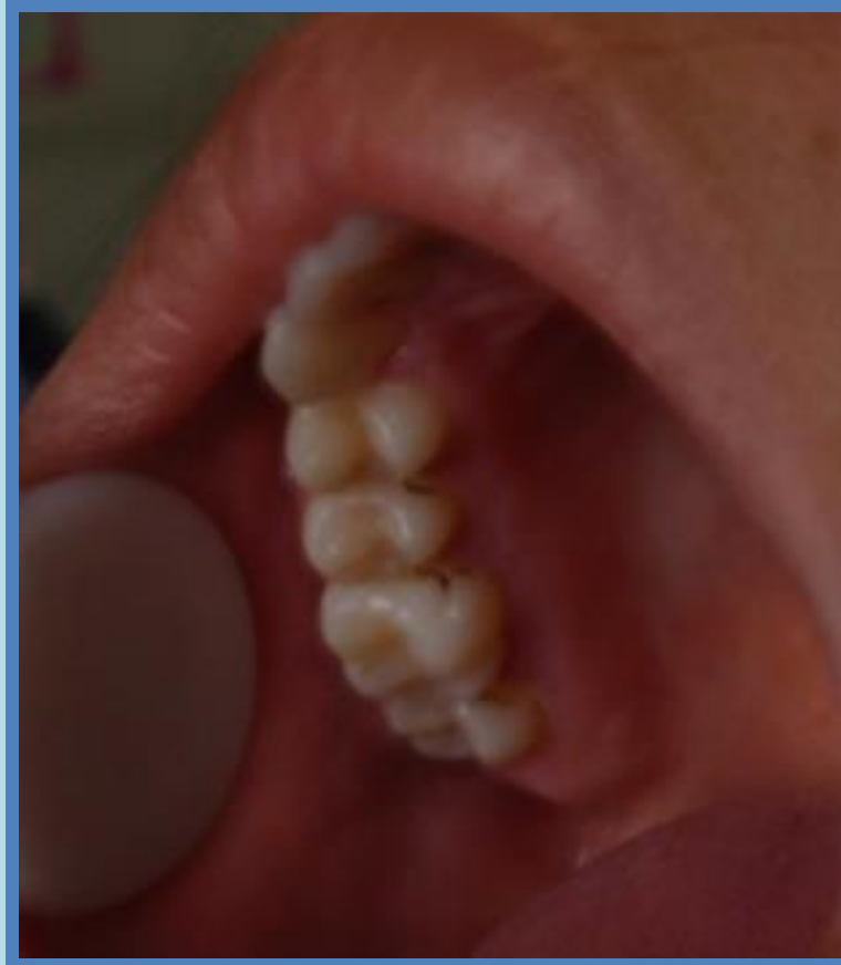
Imagen 1. PMSP con Tubérculo de Carabelli.