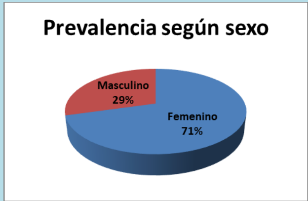
Gráfico 1. Prevalencia del Tubérculo de Carabelli según sexo.