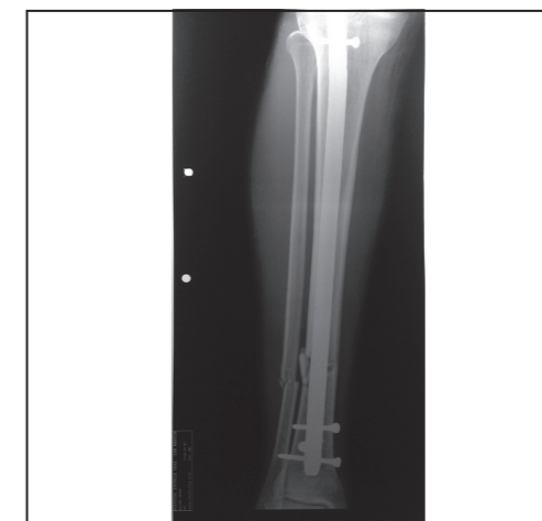
Placa radiográfica: frente fractura de tibia y peroné con osteosíntesis: clavo endomedular con tornillos

Desde el primer día de su estadía estuvo sometido a tracción esquelética transcalcánea para reducir y alinear las fracturas; posteriormente la conducta fue quirúrgica para colocar elementos de osteosíntesis.