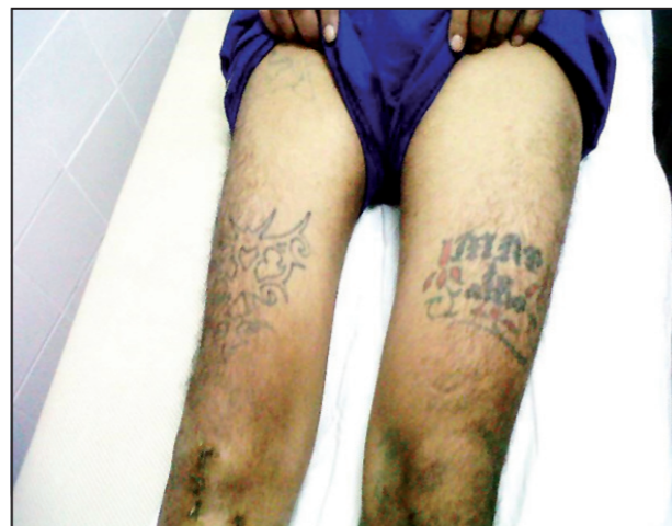
Hipotrofia muscular de cuádriceps

Para la valoración muscular se utilizó la Escala Muscular de Daniels, con valores de 0 al 5, siendo 0 la ausencia total de movimiento y 5 la presencia de movimiento total con resistencia máxima.