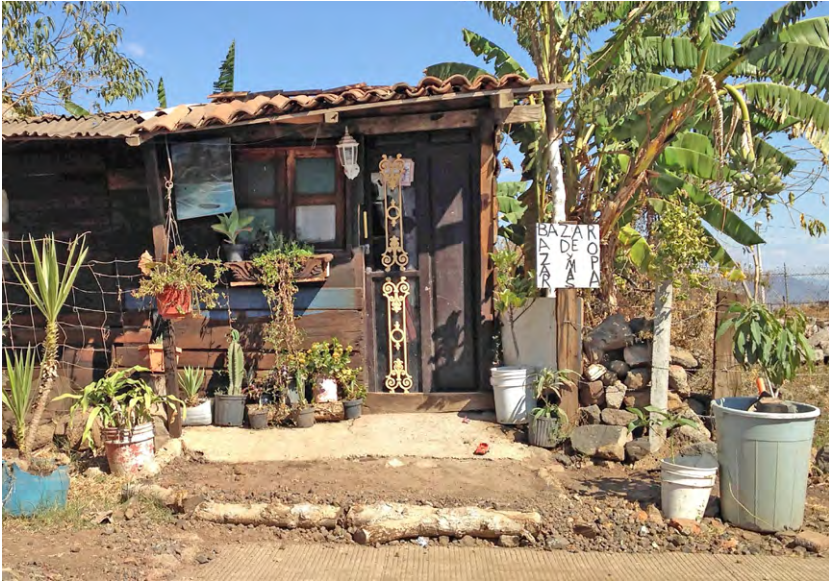
Figura 3. Local comercial de ropa en la colonia informal Ciudad Jardín. Rayito Flores, 2015

Como resultado del diagnóstico realizado, se encontró que, además de pertenecer a un polígono de alta marginación, también presenta grandes zonas de construcciones edificadas con materiales perecederos, es decir, prevalece la cultura del desecho reflejado en las viviendas, también en locales comerciales, equipamiento urbano como escuelas y espacios de recreación.