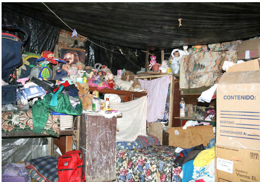
Figura 8. Interior de una vivienda de desecho en la colonia informal Ciudad, Jardín. Rayito Flores, 2015