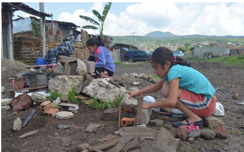
Figura 6. Niños jugando en la colonia informal Ciudad, Jardín. Rayito Flores, 2017

Respecto de la legalidad del predio, se tiene un 56 % de ilegalidad en los entrevistados; la forma en que obtuvieron el terreno de los porcentajes más altos son el 42 % como invasión y el 36 % como propio. La forma de conseguir el terreno, el 40 % respondió que el líder le fue dado "en la lucha", seguido del 24 % como comprado y 18 % respondieron que llegaron ahí. Como propiedad de la vivienda consideraron el 60 % en propio y el 22 % en vivienda compartida.