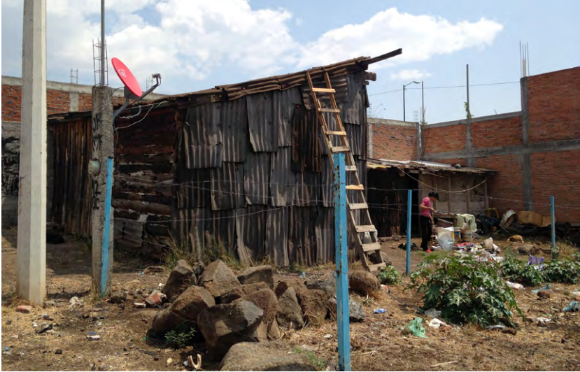
Figura 2. Vivienda de desecho en la colonia informal Ciudad Jardín. Rayito Flores, 2015

Como resultado del diagnóstico realizado, se encontró que, además de pertenecer a un polígono de alta marginación, también presenta grandes zonas de construcciones edificadas con materiales perecederos, es decir, prevalece la cultura del desecho reflejado en las viviendas, también en locales comerciales, equipamiento urbano como escuelas y espacios de recreación.