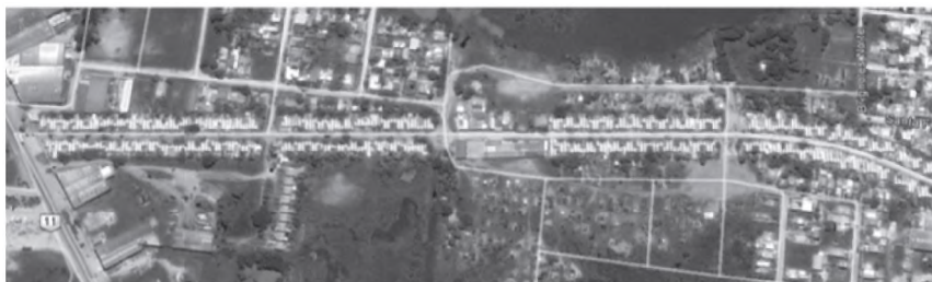
Imagen aérea del sector. El asentamiento observado con un desarrollo lineal es el Bo. Toba, en la parte inferior se encuentran asentamientos (hoy consolidados) originados por población excedente.