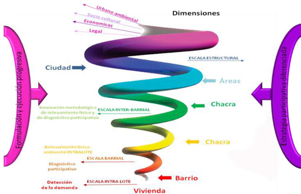
Gráfico 1: escala de actuación

La intervención presentó un carácter intersectorial, del sector gubernamental, representado en el Instituto Provincial de Desarrollo Urbano y Vivienda (IPDUV), que implementa en nuestra provincia el Programa de Mejoramiento Barrial (PROMEBA) que abarcó siete hectáreas y, por otro lado, la intervención sobre varios aspectos: el acceso a la propiedad de la tierra, al posibilitar la regulación definitiva de cada lote, y el fortalecimiento de la organización comunitaria de los asentamientos.