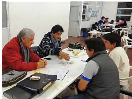
Figuras 9 y 10

Otro tema ha sido el de la influencia de luces y sombras en la configuración de la forma arquitectónica y la utilización del color para dar significado y confortabilidad a los espacios tanto interiores como exteriores. Al dibujo a mano alzada de los croquis se incorpora también el dibujo digital en programas SketchUp y AutoCad.