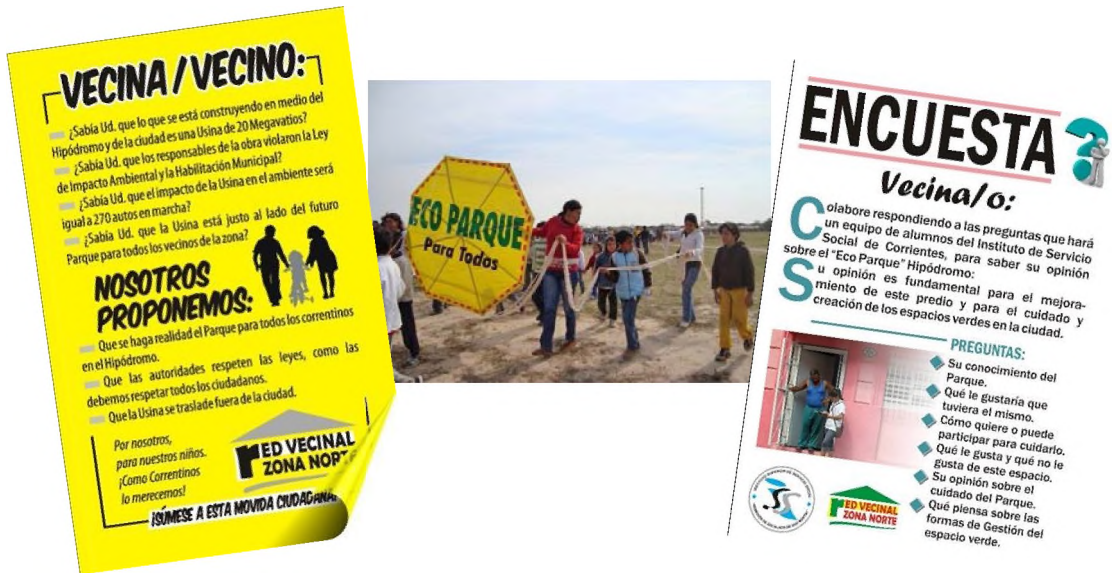
Gráfico 2: volante informativo. Gráfico 3: encuesta Foto 2: movilización por Eco Parque