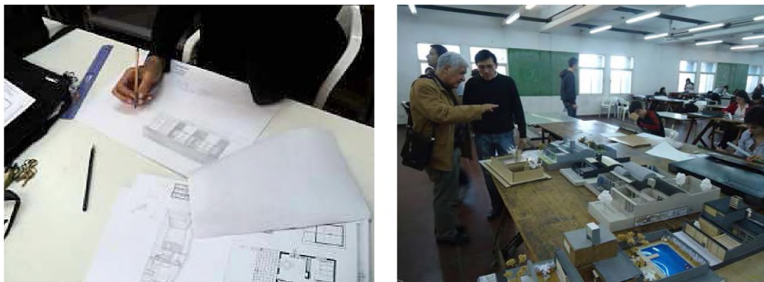
Figuras 1 y 2

Las imágenes que acompañan el artículo muestran cómo se fue elaborando esa relación inter-cátedras. En las figuras 1 y 2, entre Sistemas de Representación y Morfología 1.