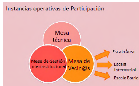
Foto 1. Reunión barrial en zona sur de Resistencia. Gráfico 1: Mesas de Gestión ProMeBa Chaco