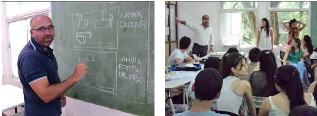
Figuras 3 y 4

nes para tomar fotografías y fijar la imagen que se iba a dibujar. ¿Es eso conveniente? Las imágenes no se obtienen de manera automática, pues los alumnos deben seleccionar la toma para posteriormente dibujarla. Esta manera o “forma” de proceder permitió a los alumnos tener a su disposición las imágenes obtenidas para analizar convenientemente los distintos conocimientos involucrados. Posteriormente, se hizo una puesta en común, una colgada en la cual los alumnos explicaron cómo habían encarado el tema y los docentes verificaron la comprensión de la consigna y el nivel alcanzado en la resolución de los croquis.