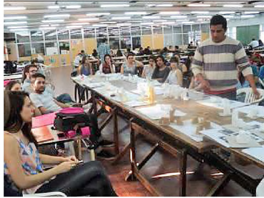
Figuras 5 y 6

Desarrollamos además teóricamente el tema de las superficies planas, curvas, alabeadas, plegadas, con ejercitación en clase. Al conocimiento de las superficies se incorporó la posibilidad de rigidización de estas mediante la utilización de plegados, analizando la estructura de las formas obtenidas, así como las características, cualidades y calidades de los materiales utilizados. Lo anteriormente citado fue ejercitado convenientemente en maquetas y registros gráficos.