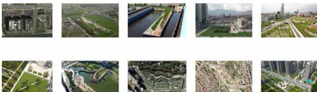
Imagen 1. Diversidad de ejemplos tomados para analizar las variables de forma y significado en relación con el espacio público contemporáneo.

Arroyo (2011) destaca dos tipos de fenómenos "simultáneos y concomitantes" en las transformaciones del espacio público contemporáneo: