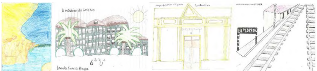
Imagen 2. Expresiones gráficas resultados de los talleres juveniles.

talleres juveniles, en los que se formuló una serie de tareas creativas y de reflexión, que no necesitan presentación ni explicación en profundidad, ya que los resultados guían claramente el camino que seguir. Estos jóvenes dejaron grabadas huellas gráficas que denotan el compromiso para con su ciudad. Igualmente es significativo subrayar el funcionamiento de la actividad en sí como instrumento educativo y de aprendizaje, ya que estas acciones generaron una serie de pensamientos, conversaciones y dinámicas en el aula que acercan a sus protagonistas a la ciudad, despertando en paralelo y de manera paulatina un proceso de implicación ciudadana.