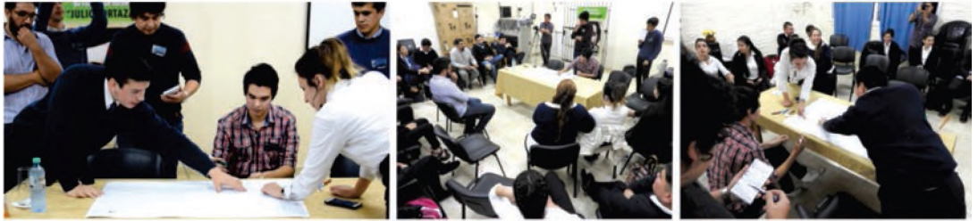
Imagen 1. Encuentros abiertos de diagnóstico y talleres juveniles.

que se han desarrollado. Este letrado en materia de urbanismo, en diferentes enunciados estableció los parámetros que caracterizan esta forma de intervención, entendida como radical e invasiva, que considera la ciudad como un organismo vivo susceptible de ser transformado y regenerado. Este proceso va a introducir una nueva dinámica dentro de la ciudad, por lo cual se fomentaron procedimientos activos y colaborativos de enseñanza-aprendizaje en la comprensión y resolución de los problemas, buscando fortalecer la identidad patrimonial y cultural de la comunidad.