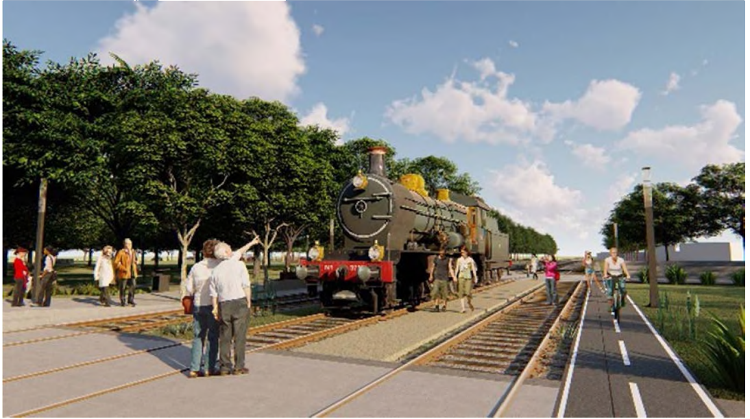
Imagen 3. Propuesta elaborada a partir del mapeo para la ciudad de Empedrado, Corrientes.

que a partir de lineamientos estratégicos con bases sólidas por medio de estos procesos participativos, se procura rescatar, proteger y darle uso al legado histórico, con corredores y nodos que actúen como hitos atractores buscando la recuperación e integración de áreas degradadas y obras arquitectónicas emblemáticas, tal como lo prevé Lerner (2005) en su obra icónica: "tocar un área de tal modo que pueda ayudar a curar, mejorar, crear reacciones positivas y en cadena".