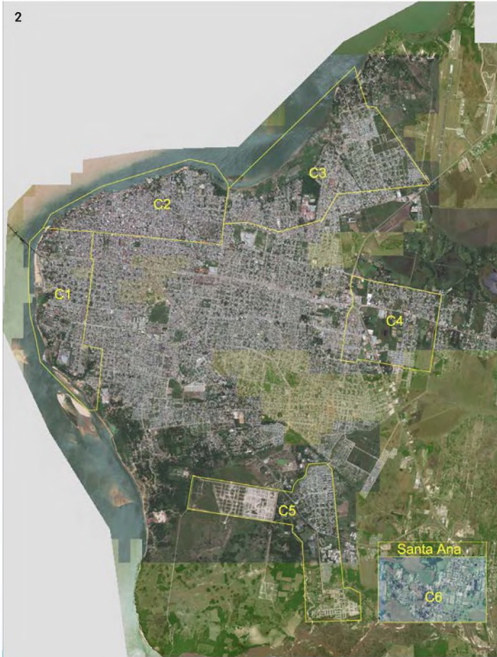
Figuras 1 y 2. Áreas asignadas (AA) para prácticos en el Gran Corrientes y el Gran Resistencia.

Todas estas áreas asignadas para desarrollar el trabajo práctico están caracterizadas por presentar algún tipo de situaciones urbano-ambientales vinculadas con el agua.