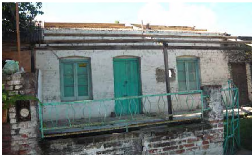
Imagen 2. Vivienda obrera. C. 1920. Cerco de madera reemplazado por muro y herrería típica de 1940. Fuente MPM, abril de 2016