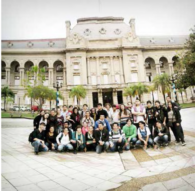
Imágenes 4, 5 y 6: viaje a las ciudades de Paraná y Santa Fe, 2014.