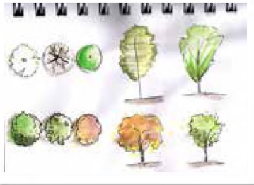
Imágenes 7, 8, 9 y 10: cuaderno de bitácora de un estudiante de 3. er año.