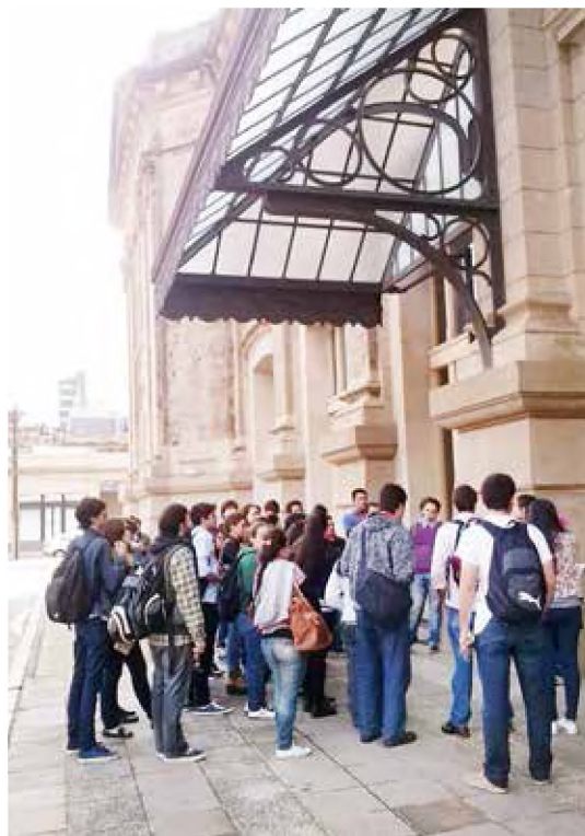
Imágenes 1, 2. Shopping y estación Belgrano. Santa Fe, 2014.