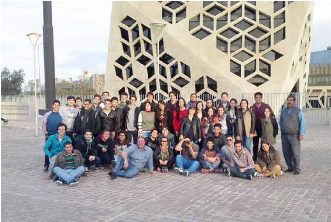
Imagen 3. Córdoba, 2015.