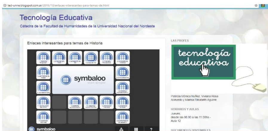
Figura 5: Captura de pantalla Blog de TE Profesorados.

Por su parte, D5 en las clases utiliza presentaciones en Power Point y, ocasionalmente, Prezzi. Trabaja con conferencias cortas de una especialista española en Tecnología educativa. Otros aplicativos para la instancia no presencial son: Google Drive, Grupo Yahoo y Blog. Las inicia con actividades de recuperación de conocimientos previos, a modo de hilo conductor entre lo dado y lo nuevo.