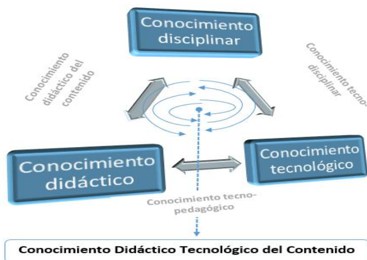
Figura 1: Componentes del modelo TPACK.

Este modelo desarrollado y extendido en EE.UU amplió sus horizontes en los últimos tiempos tanto en investigación como en su utilización en otros ámbitos. Se demostró su eficacia en variados contextos educativos y niveles de enseñanza y en acciones investigativas y de formación del profesorado; sin obviar la construcción de un modelo teórico que garantice la comprensión del comportamiento de las TIC en los procesos de enseñanza y aprendizaje (Anderson, Barham y Northcote, 2013).