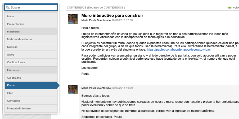
Figura 4: Captura de pantalla del Aula Virtual de NTIC