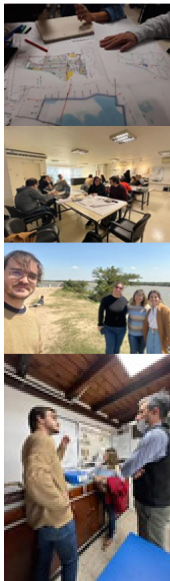
Figura 1. Imágenes del proceso de elaboración del plan base de Goya (2022).

Se ha trabajado entonces, como cierre del trabajo final del curso de posgrado, con la metodología denominada plan base. En este caso, presentaremos el que hemos elaborado para la ciudad de Goya, provincia de Corrientes. Consideramos que aún es una experiencia preliminar porque el proceso está en desarrollo, habiendo comenzado el reconocimiento de la ciudad y trabajado con diferentes áreas del municipio en la etapa de diagnóstico y, luego, hemos llegado a plantear el esquema para un plan base, pero está programada la etapa de presentación de los resultados y debate ante el municipio y los demás actores de la sociedad que intervienen en un proceso de estas características.