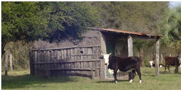
Imagen del tradicional rancho correntino, propio del acervo cultural-tecnológico de Corrientes, y acorde al clima regional "calido-húmedo". Sin protección de las galerías y bajo la inclemencia climática se produce un proceso de degradación continuo y rápido de los muros externos.

actividad, pero implementados con el objetivo de dotarlos de un tiempo de servicio superior al autóctono, incorporando el factor económico de un mínimo o nulo mantenimiento para su uso continuo e intenso, pues el tradicional "enchorizado de adobe" del rancho correntino autóctono, se degrada rápidamente si no recibe mantenimiento continuo y adecuado.