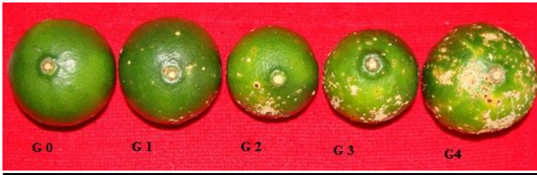
Figura 2. Escala Mazza-Rodríguez.

La toma de los datos y la evaluación de los mismos se llevaron a cabo durante el mes de Marzo del 2016. Con los resultados obtenidos se realizó un análisis de varianza (ANOVA) y posteriormente un test de Ducan, mediante el software Estadístico Infostat