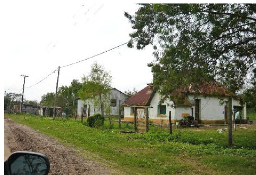
7. Conjunto residencial del complejo tanninero Z