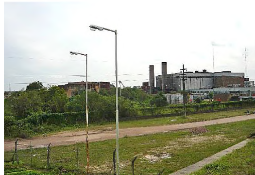
5. Usina eléctrica y área ferroviaria