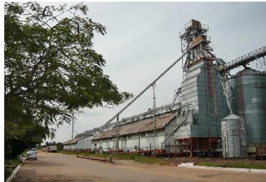
3 Silos en el área portuaria de Barranqueras