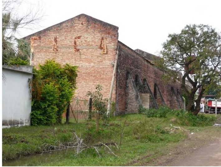
8. Frigorífico FACA. Pto. Vilelas