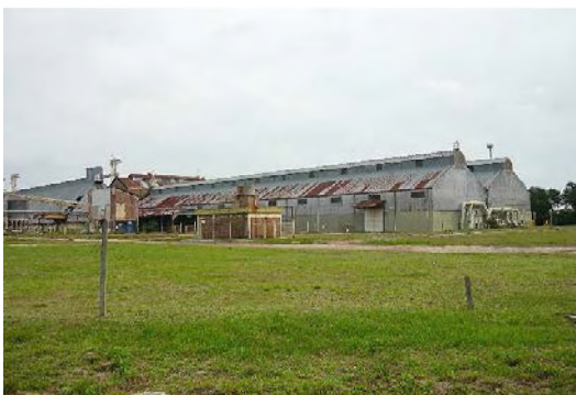
6. Antigua fábrica de tanino Z. Pto. Vilelas