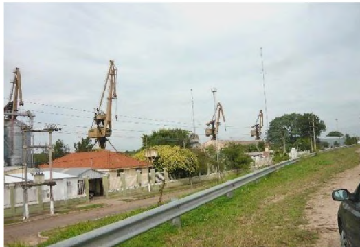
2. Área portuaria de Barranqueras desde la defensa