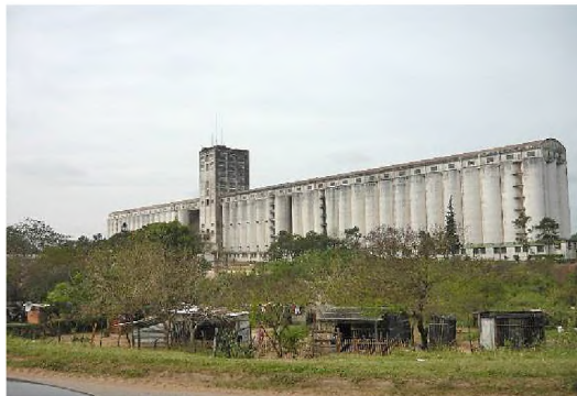
4. Junta Nacional de Granos