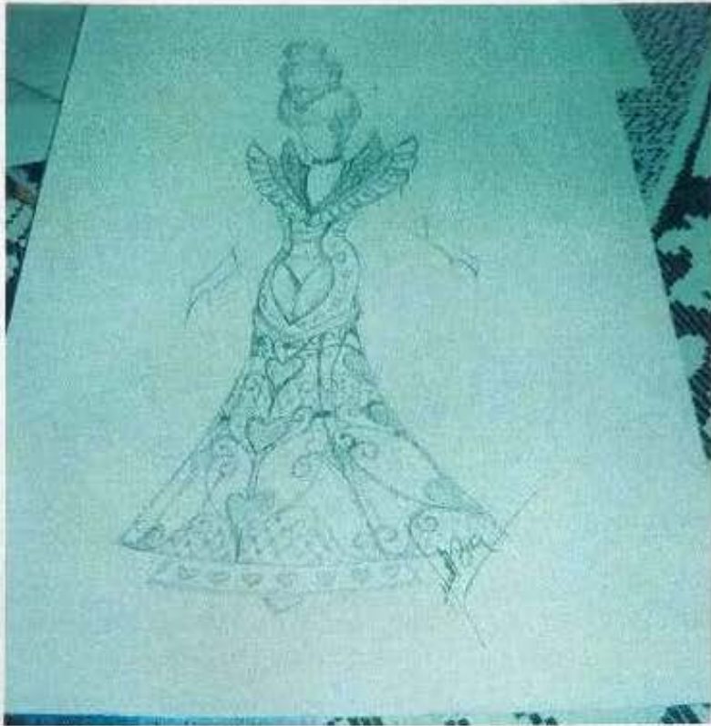
Boceto del Diseñador n° 3. Corrientes, 2008.