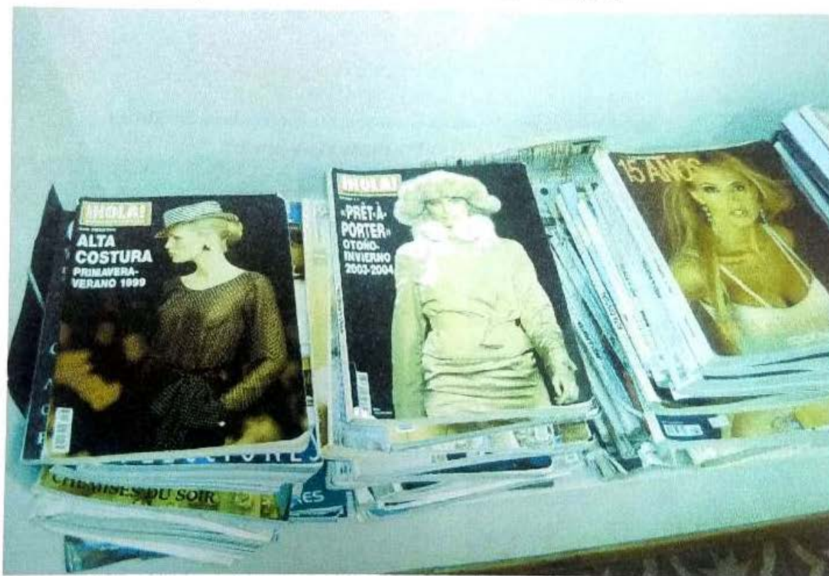
Revistas del diseñador nº 1. Corrientes, 2008