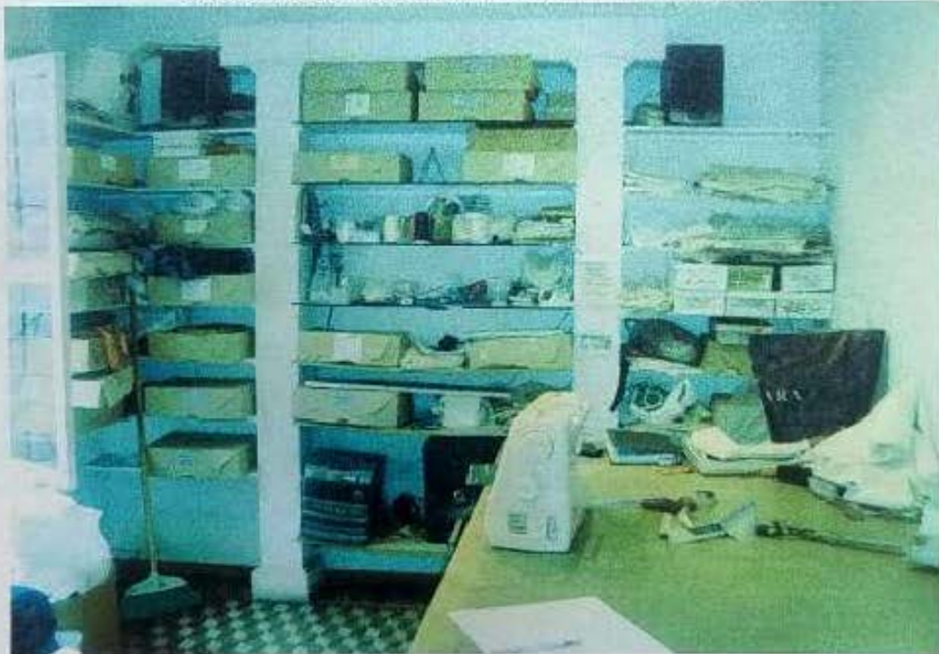
Taller del diseñador n° 1. Corrientes, 2008