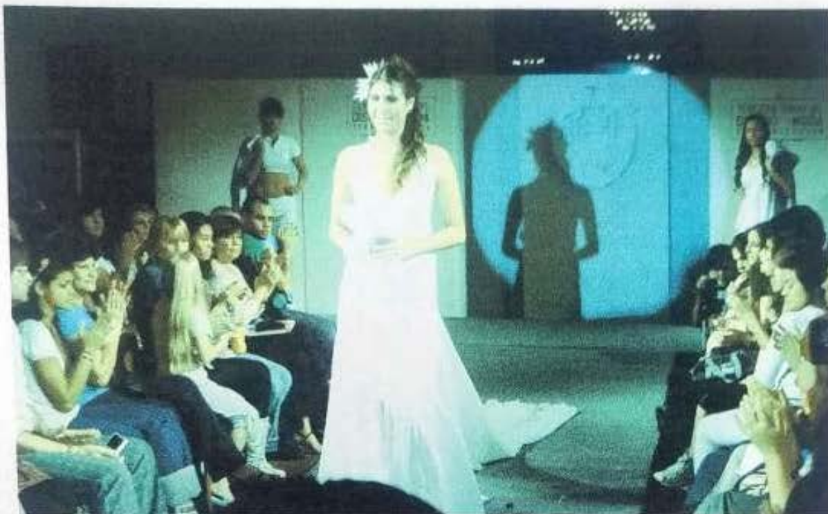
Semana del diseño y la moda. Sociedad Española. Corrientes, 2008