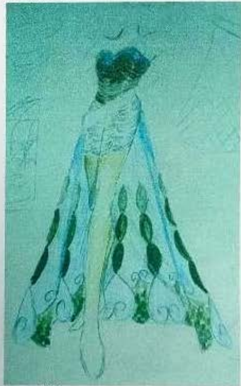
Bocetos del Diseñador n° 3. Corrientes, 2008.