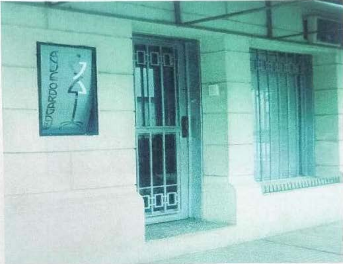
Casa de moda de alta costura. Diseñador n° 1. Corrientes, 2008