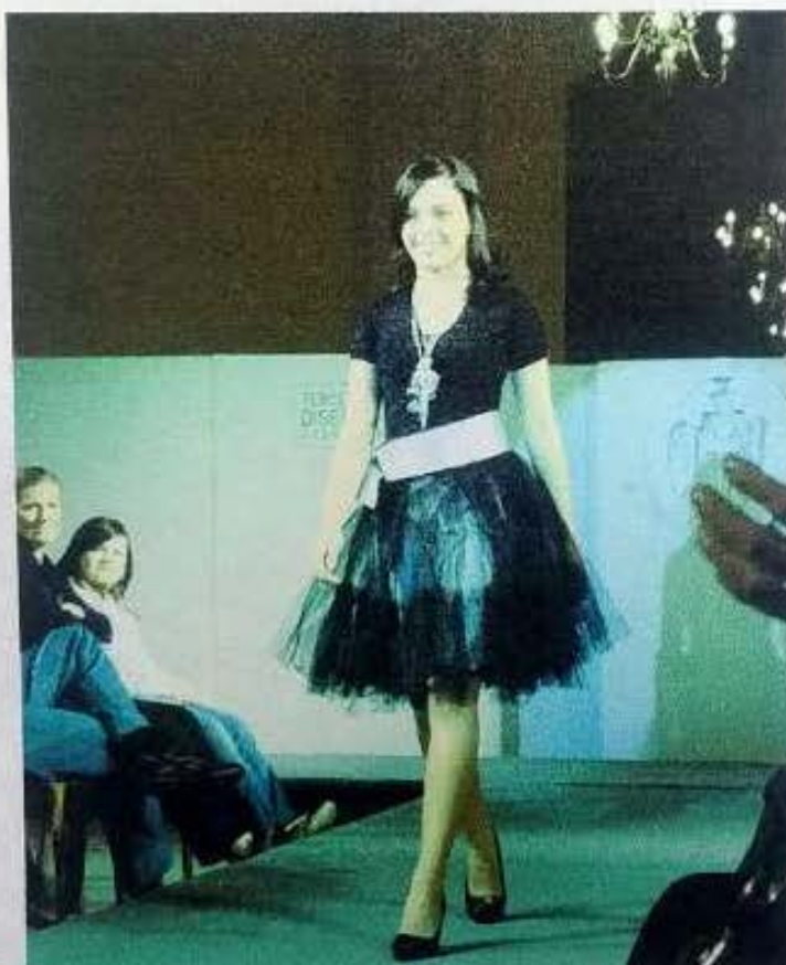
Vestido con falda de tul, colección primavera-verano. Corrientes, 2008