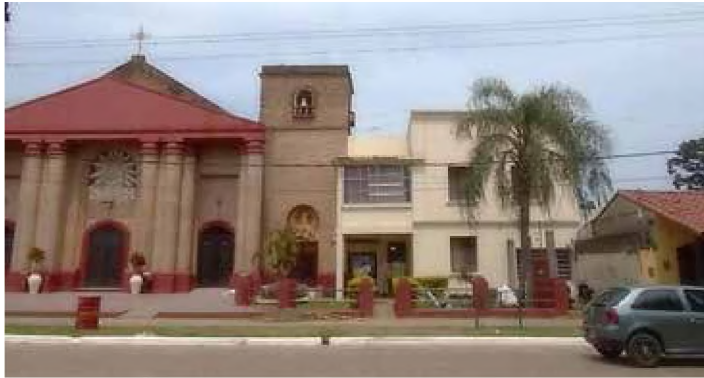
Figuras 9, 10 y 11. Ejemplos de convivencia de tipos arquitectónicos correspondientes a diferentes momentos históricos. De izquierda a derecha: casa ecléctica italianizante junto a una casa de galería colonial; arquitectura ecléctica historicista junto a arquitectura moderna y a una casa de galería; por último, un ejemplo de eclecticismo medievalista con torre circular.