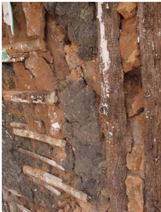
Figura 4. Arquitectura de tierra en Caá Catí: técnica de estanteo.

La adopción del ladrillo como relevo del estanteo en los muros, de la cal en los morteros, de las tejas francesas en lugar de las españolas, de los entablados que desplazaron a los encañizados en los corredores y de las piezas estructurales realizadas en máquinas de corte y torneadas fueron cambiando la fisonomía del espacio urbano.