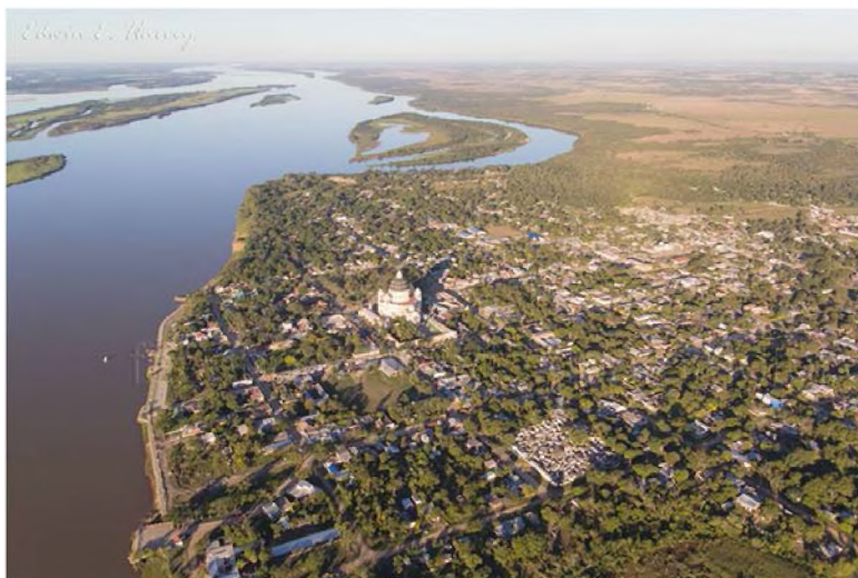
Fig.6: Foto aérea del sector, donde se aprecia el amplio curso fluvial con islas alargadas; el borde costero sinuoso y el trazado urbano.

No solo la urbanización es responsable de la disminución de la selva en galería. En los últimos años se han sumado, sobre el borde ribereño, emprendimientos turísticos fuera del área urbana, que ofrecen alternativas de pesca con cabañas y zonas de acampada. Estos, si bien son de pequeña escala, ya han realizado alteraciones en el bosque de ribera, con la disminución de la densidad y la desaparición del sotobosque, así también en la barranca, que fue despojada de su cobertura vegetal, lo que acelera la erosión fluvial y pluvial (figuras 7 y 8).