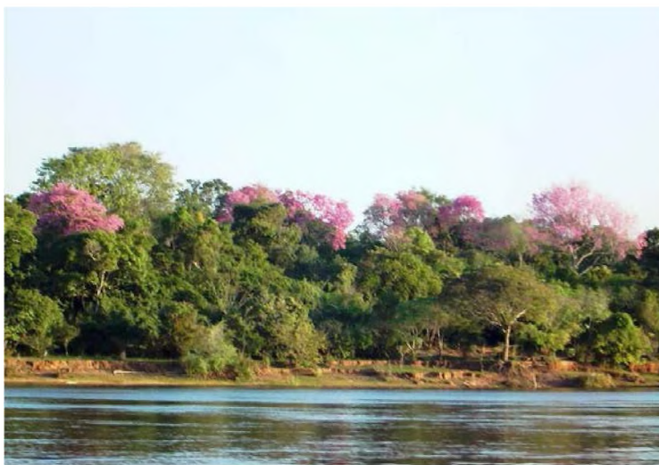
Fig.5: bosque ribereño con gran diversidad, con árboles altos, entre los que se destaca la floración del lapacho. En este sector la barranca tiene menor altura.

Por estar en relación con el flujo de agua, que se comporta como un excelente medio de transporte de materia (sedimentos, semillas, etc.) y en permanente intercambio con los paisajes que atraviesa, son ecosistemas muy abiertos, con estructura y dinámica que dependen de los llamados pulsos hidrológicos (períodos de crecienta y de bajante), que condicionan su estructura. Encontramos, básicamente, en el sector de estudio dos tipos, según clasificación del mismo autor: los bosques de varzea , jóvenes, de formación reciente, que se forman en los bancos, en las islas y costas sometidos a un régimen hídrico de alta fluctuación y procesos de erosión y deposición muy activos, con baja diversidad con una especie dominante (principalmente con los géneros Salix , Tessaria , Croton , o Cecropia ), y los bosques de galería o bosques ribereños, ubicados en las costas del Paraná y sus afluentes, sobre barrancas altas, poco inundables, en suelos “estables”. Los últimos son altos (12 - 35 metros) y tienen mayor diversidad que los anteriores, con predominio de árboles de copa globosa distribuidos en varios estratos (figura 5) (NEIFF, s/f: 3-4).