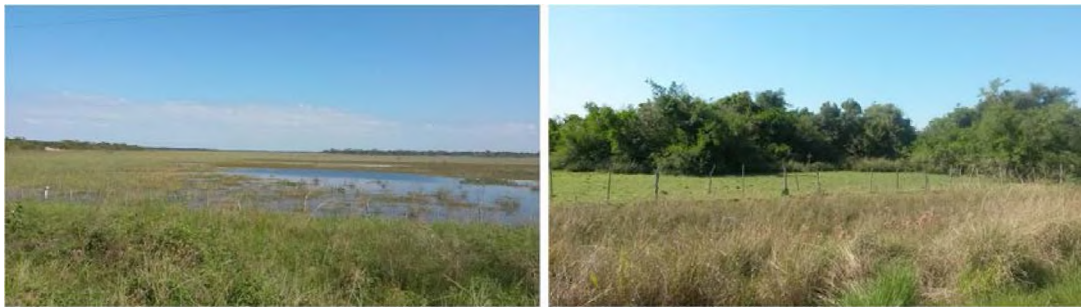
Fig.3: Paisaje natural en la zona de acceso a Itatí, corresponde a la planicie deprimida inmediata al albardón, con zonas de lagunas (izquierda) y bañado y bosques hidrófilos e islas (derecha).

visualiza como lagunas o bañados en las zonas negativas y selva en isletas en las positivas más altas. Este paisaje forma parte del contexto paisajístico de la zona en estudio y puede ser percibido desde la ruta N.º 12 y desde el camino de acceso a la localidad (figura 3).