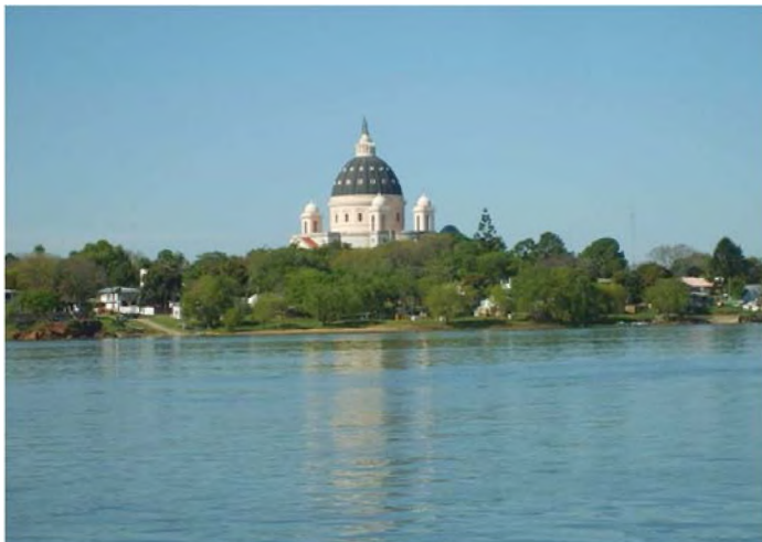
Fig.7: la Basílica de Ntra. Sra. de Itatí sobresale en la fachada fluvial y se convierte en un punto de referencia en el paisaje. Se ve una barranca de escasa altura.

Hemos referido que la ciudad está emplazada entre dos salientes rocosas, contenida por un estrecho albardón arenoso. La fachada fluvial presenta un borde alto o barranca de altura media, con presencia de piedra arenisca suelta en algunos sectores y selva ribereña donde sobresale la atractiva morfología de la basílica de la Virgen de Itatí, que alcanza una escala monumental (86 m de altura) y se destaca no solo en el paisaje urbano, dado que es visible desde prácticamente todos los rincones del poblado, sino que puede ser apreciada desde puntos lejanos, ya sea desde la ruta nacional, como desde el río e inclusive en horarios nocturnos, cuando opera como un faro de referencia (figura 7). La imagen del edificio predomina en el paisaje contextual debido básicamente a dos factores: en primer lugar, está implantada en una planicie baja, con bañados y selvas en isla, como se explicó anteriormente, y por tanto, discontinuas, que dejan entrever la silueta del edificio; en segundo lugar, el resto de la edificación urbana es de baja densidad –no superan las dos plantas–. Asimismo, desde el río se destaca el volumen acompañado por una densa masa arbórea que no supera los 10 metros de altura, formada en gran parte por especies de la selva en galería, que han sobrevivido a la acción antrópica o se han reproducido naturalmente en los patios de las propiedades.