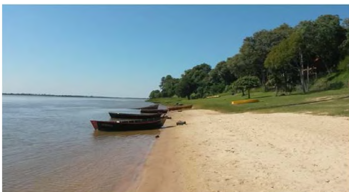
Fig.2 zona de depósito de sedimentos (arena) playas, con barrancas más o menos altas por detrás, al final una saliente rocosa con bosque en galería degradado. Foto: V. Valenzuela, 2014.

El río Paraná, en este sector, que corresponde al Alto Paraná, se amplía luego de la represa de Yacretá, y presenta un diseño de cauce múltiple, sembrado de bancos e islas de forma alargada en dirección este-oeste (MINOTTIA, 2013: 68) con vegetación más o menos joven. El borde costero correntino está constituido por un dique natural de origen sedimentario, cortado espaciadamente por arroyos, activos y antiguos, de los ríos que desaguan en el Paraná; con presencia de roca arenisca ferruginosa que aflora espaciadamente formando salientes que se adentran en el curso fluvial, que provocan una dinámica fluvial que produce el continuo socavamiento y depósito de sedimentos. Debido a esta dinámica, se genera un borde sinuoso e irregular, interrumpido por desembucaduras de arroyos, con entrantes y salientes, con sectores altos y bajos, donde se definen al menos tres sectores diferenciados en cuanto a sus condiciones naturales: bañados o zonas bajas, donde el río ingresa en las crecientes, cubiertos de vegetación; zonas de depósitos arenosos o playas, en general, continuo a las salientes rocosas (aguas abajo), y las zonas más altas del dique o albardón que forma barrancas (figura 2).