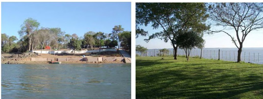
Fig.9: emprendimientos turísticos de distintas escalas y servicios que interrumpen o degradan el bosque y el borde ribereño.

El turismo rural ha ido en aumento en los últimos años en busca, principalmente, de la pesca deportiva. Los emprendimientos se instalaron en la ribera del Paraná, en las cercanías del poblado, y produjeron una importante deforestación que provoca, entre otras cosas, problemas de erosión fluvial y pluvial.