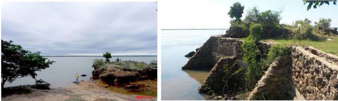
Fig.8: a la izquierda el paisaje perdido. Afloramiento rocoso anterior a la construcción del paseo costero. Foto: Celso M. Andrade s/f. A la derecha nuevo muro de contención en el mismo lugar. Foto: V. Valenzuela 2014.

La traza colonial se alejó del borde costero, que era considerado inestable debido a la dinámica fluvial –los períodos de creciente y bajante, causante de las inundaciones y a la erosión pluvial y fluvial de las costas—. En las crecientes extraordinarias de 2013 (h. del río=7,76) y 2014 el agua penetró unos 200 m en la trama urbana. Esto demuestra que la ciudad colonial, si bien estaba a salvo de las crecientes periódicas normales, no lo estaba respecto de las extraordinarias. Esta situación sumada a que la inversión pública ha estado dirigida al turismo religioso, fueron las principales causas del retraso en propiciar la relación ciudad-río. Actualmente se ha construido un muro de contención y paseo denominado Costanera del IV Centenario, que estabilizó el borde y lo hizo accesible, aunque la creciente extraordinaria de 2013 lo haya superado. Sin embargo, con la obra se ha perdido un paisaje natural de gran valor: el afloramiento rocoso que le dio la denominación y la identidad a la localidad (figura 8).