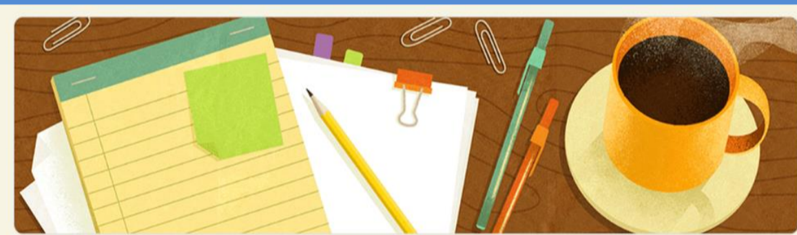
Encuesta diagnóstica "EFAs del Chaco"- Facultad de Cs. Veterinarias UNNE

Las Buenas Prácticas Agropecuarias (BPA) se han convertido en pilares fundamentales para garantizar seguridad alimentaria, protección ambiental y el bienestar de quienes trabajan en el sector. En Argentina, estas prácticas son obligatorias para ciertos cultivos como frutas y hortalizas. Con la creciente nueva ruralidad producto de la integración y la interconexión global, las Escuelas de la Familia Agrícola (EFAs) emergen como protagonistas educativos en zonas rurales.