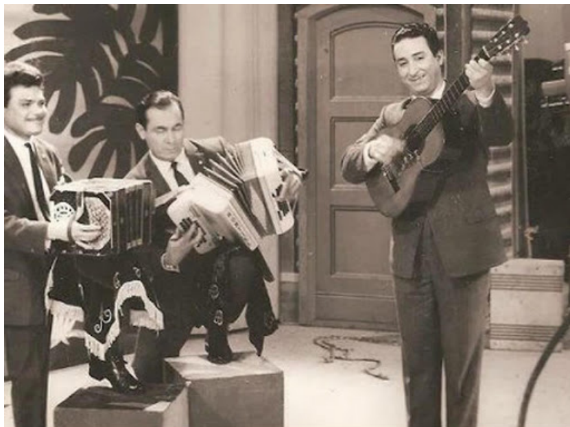
Imagen 6. El Patio de Don Tunque