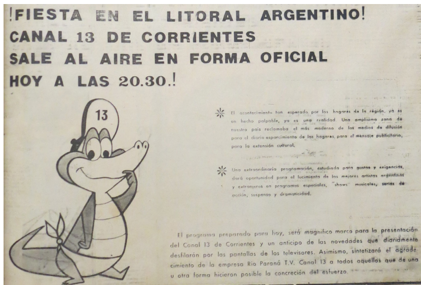
Imagen 4. El Litoral (30 de junio de 1965)