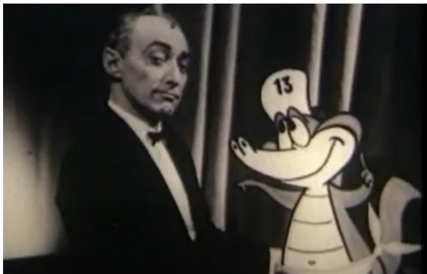
Imagen 5. Fotogramas de la emisión aniversario