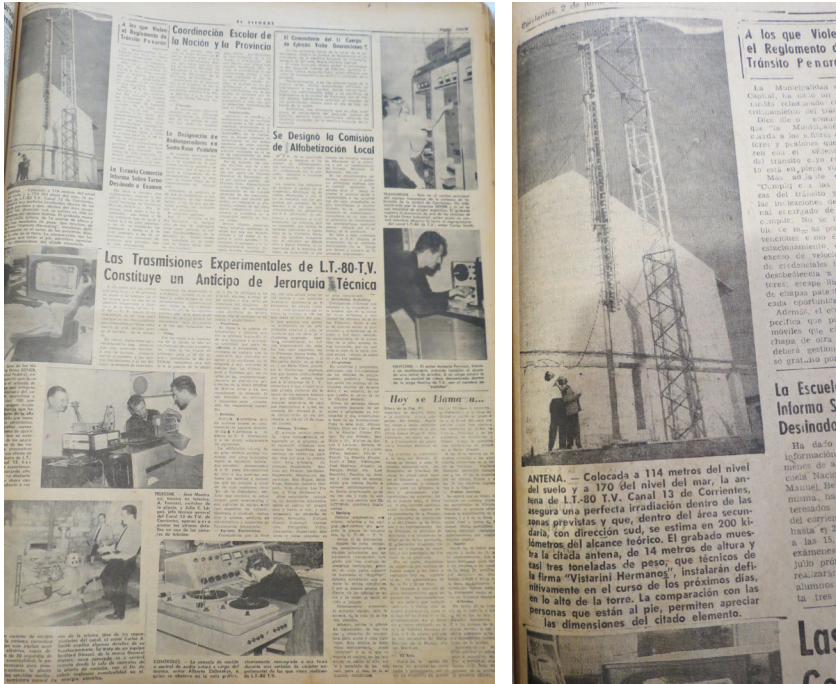
Imagen 3. El Litoral (24 de mayo de 1965)