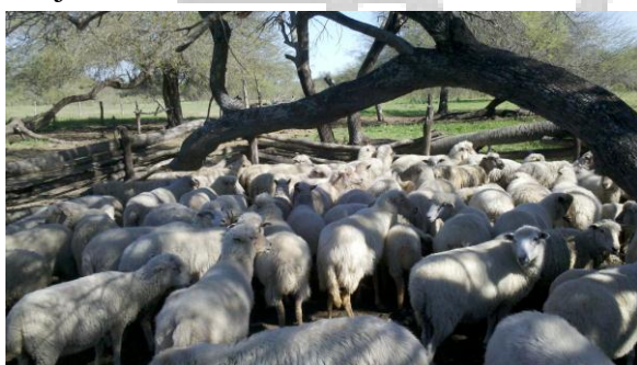
Imagen 1: Corral de encierre tradicional ovejas criollas formoseñas.

Solo un bajo porcentaje suplementa a los animales en alguna época del año (25,8%). El único tratamiento sanitario que se