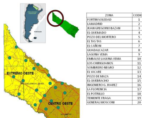
Figura 1: sitios de muestreo.

Se trabajó en 20 sitios de muestreos, distribuidos uniformemente en el territorio de los tres departamentos del oeste de Formosa: Matacos, Bermejo y Ramón Lista. Se realizaron encuestas estructuradas (n=82) indagando sobre los aspectos relacionados a los sistemas productivos que poseen ovinos, tomando como referencia parámetros similares a los de Perezgrovas et al (2000). Los datos en soporte papel fueron luego digitalizados y se realizó un análisis descriptivo de los diversos aspectos indagados, lo que permite tener una visión sobre la tipología de los sistemas.