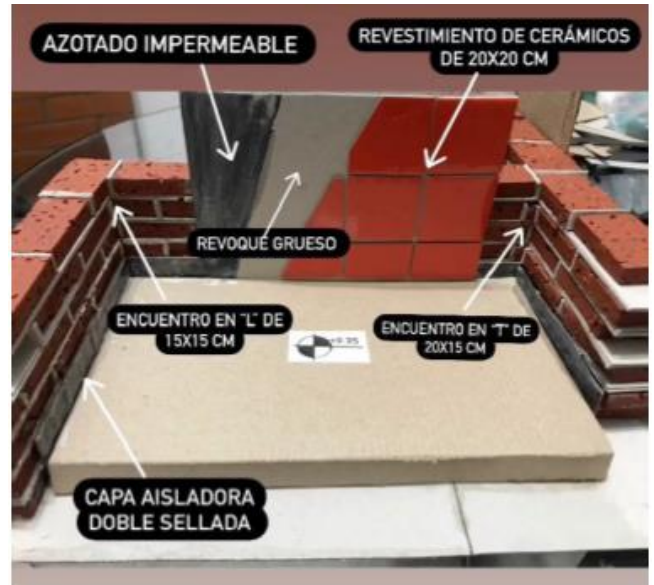
Figura 3: Maqueta de Detalle Tecnológico realizado en Construcción de Edificios I.

comprender tridimensionalmente los nudos constructivos (ver Figura 3).