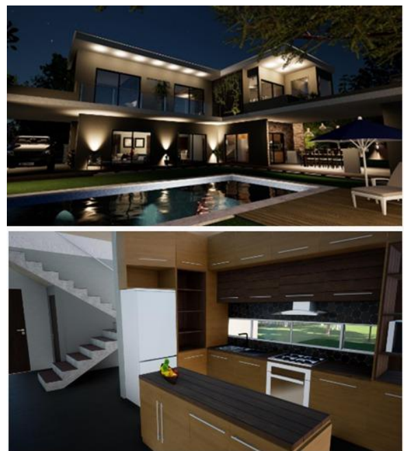
Figura 1: Imágenes de los resultados alcanzados en Arquitectura I.

Con el convencimiento de que las actividades que se plantean son fundamentales para desarrollar las competencias de pensamiento crítico, creatividad, expresión oral y gráfica, entre otras, tan necesarias para el futuro profesional, por ello se encaran diferentes instancias: grupales e individuales.