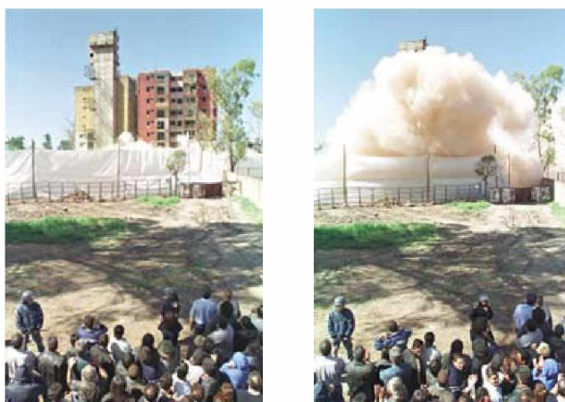
Vecinos sentados como en una platea observando la explosión de las torres de Fuerte Apache.

Según se dijo, el estado de los edificios era altamente peligroso para las personas que vivían allí, por lo que se decidió que la solución fuera el derribamiento de sus torres, lo que generó un importante conflicto el día de la explosión de las mismas, y supuso el desarraigo de quinientas familias a las que se sometió a una mudanza compulsiva.