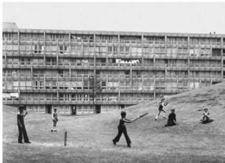
Robin Hood Gardens en Poplar (Londres) De Alison and Peter Smithson Año construcción: 1960-1972.

significaban estas intervenciones, desde extensos dispositivos paisajistas como los propuestos en Inglaterra por Alison & Peter Smithson hasta, más cerca de nuestra realidad, los barrios diseñados por los propios habitantes según los hábitos y materiales de cada región.