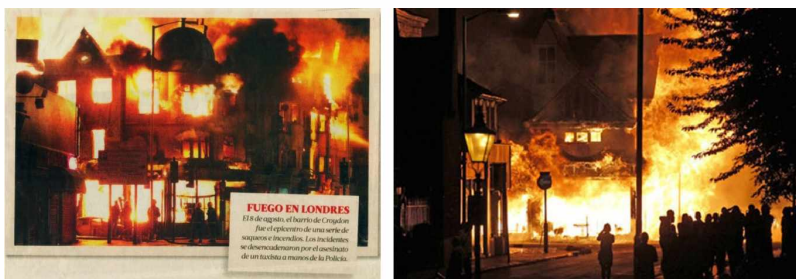
Violencia y fuego en Londres, 2011.