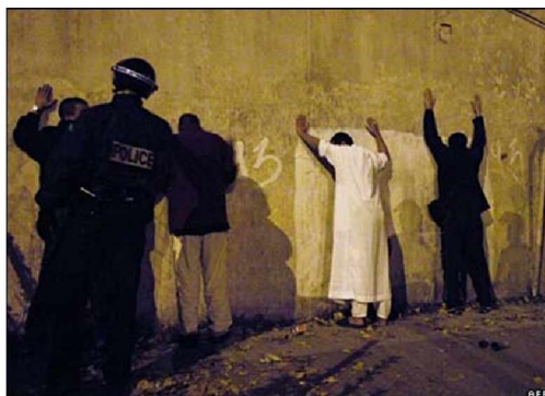
Violencia en los suburbios de Francia, 2005

Después del 11S y ante acontecimientos como los mencionados, Jacques Herzog ha dicho: