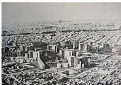
Fuerte Apache. En construcción hacia 1972.

El conjunto, de 1973, fue inaugurado para alojar a familias que vivían en villas de la Capital, en especial la Villa 31 de Retiro. El complejo se propuso en su momento, como una forma novedosa de organización urbanística, creando trece nudos con diferentes cuerpos en un terreno que ocupa veinticinco manzanas en Ciudadela.