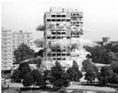
Torres de la ZUP (Zonas de Urbanización prioritarias) en el barrio de Saint-Jean de Châteauroux (Indre). Década del 60. Demolición: 2001.