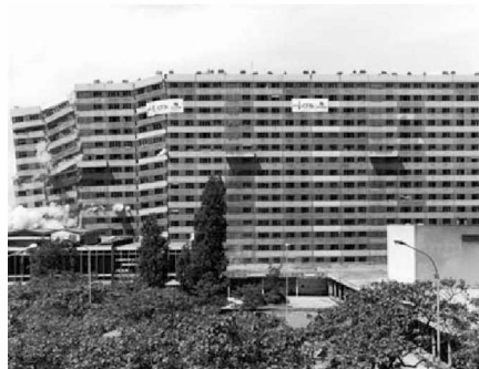
Barre Renoir en la 'Ciudad de las 4000' e La Courneuve (Île de France) Demolición: 2000 (otras demoliciones de bloques de viviendas en La Courneuve: 1986, 2001, 2002, 2003).