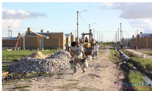
550 Viviendas en el Barrio Pirayú de la Ciudad de Corrientes, 2010.