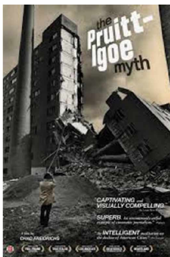
Conjunto de viviendas 'Pruitt-Igoe' en St. Louis (Missouri) De Minoru Yamasaki 1965. Demolición: julio de 1972.