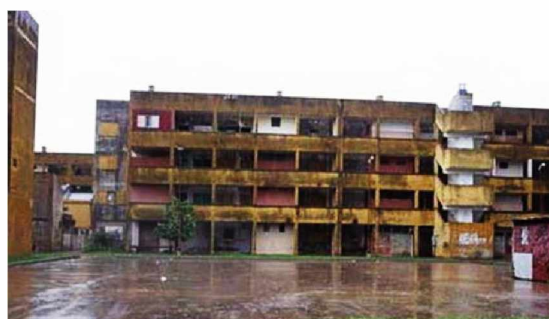
Mil viviendas. Ciudad de Corrientes. Planes FONAVI Década del 80.