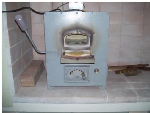
Figura 2: Mufla

En la Figura 2 se observa la Mufla empleada: