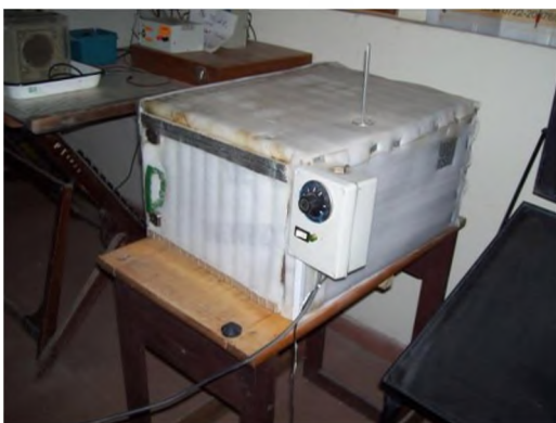
Figura 3: Horno de resistencia eléctrica para ensayos de secado

Para las pruebas de secado se contó con un horno eléctrico de 40 litros de capacidad, con control automático de temperatura de hasta 105°C, el mismo se observa en la Figura 3: