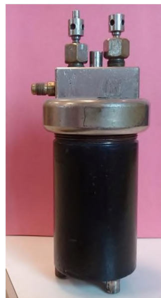
Figura 1: Bomba de Mahler

La siguiente figura muestra la Bomba calorimétrica de Mahler utilizada en los ensayos Figura 1: