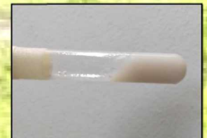
Fig. 4: Adyuvante rehidratado con dextrosa 5%.