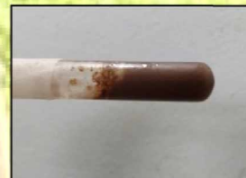
Fig. 3: Paquete globular parasitado con Babesia spp., deshidratado y reconstituido con adyuvante.