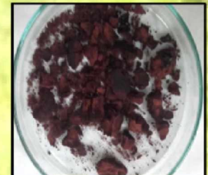
Fig. 2: Resultado del proceso de deshidratación.