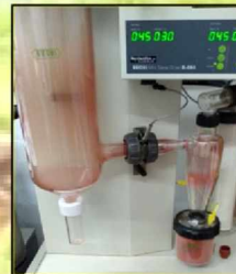
Fig. 1: Spray-dryer Buchi B-290.