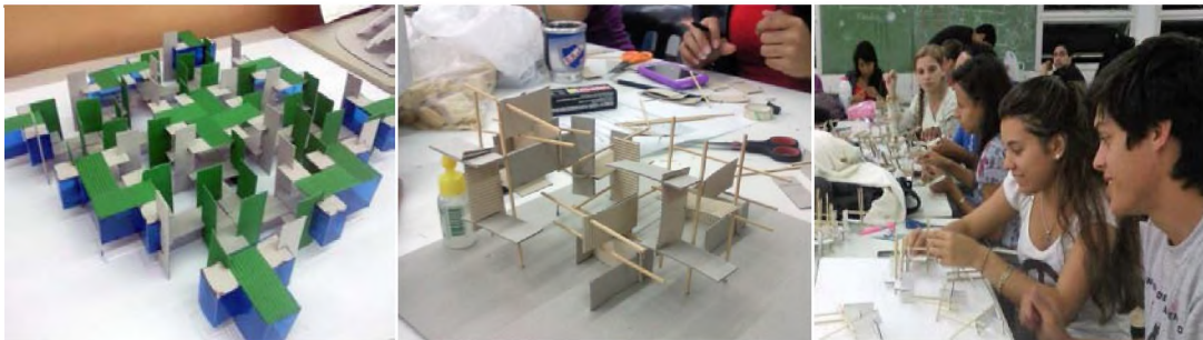
Imagen 2: ejercicio creativo 2013

Se trabajó en una primera instancia en la generación de piezas constructivas, mediante el encastre con otras iguales de múltiples maneras, tendientes a conformar un sistema objetual o espacial con una función asignada por el grupo.