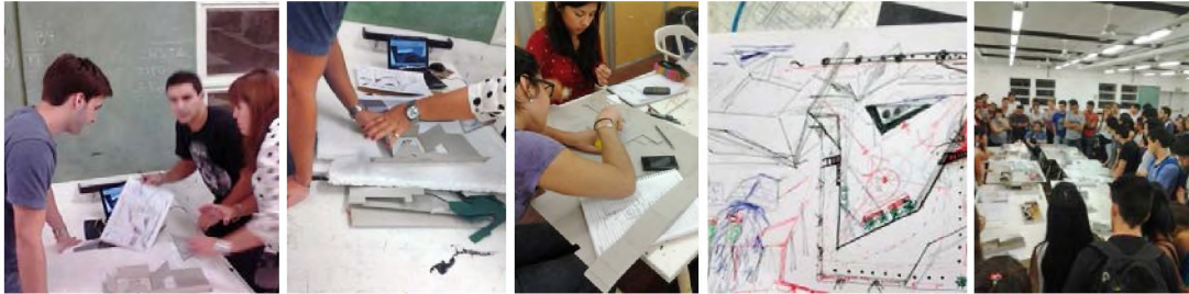
Imagen 6. Etapa Trabajo en Taller CCN