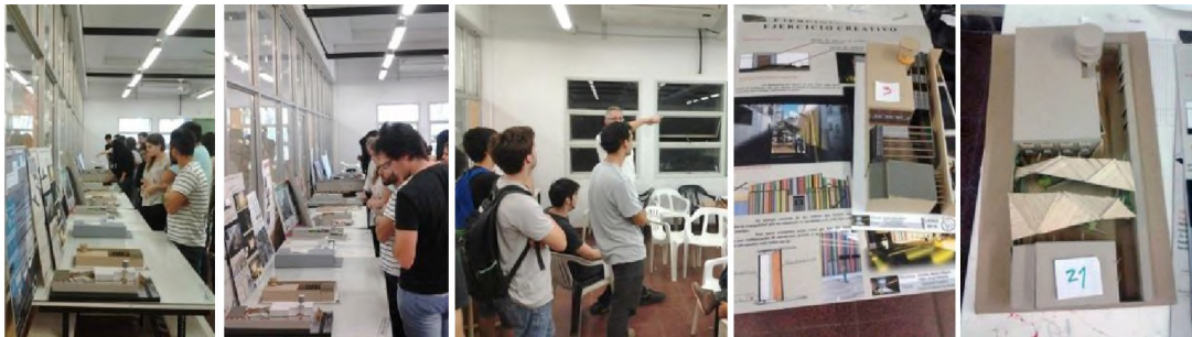
Imagen 7. Plenario final. Votación.

Al final de la exposición todos los alumnos votan las mejores propuestas.