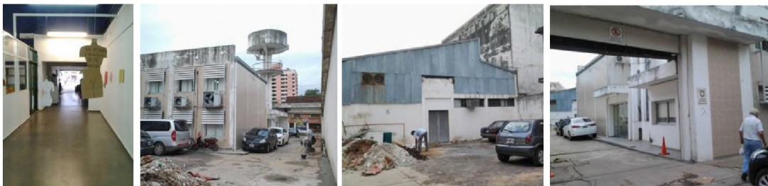
Imagen 4. Etapa Exploratoria CCN.