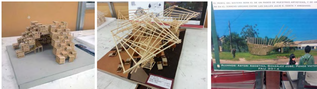
Imagen 3. Trabajo Creativo Ciclo 2014

2014. Estrategias Projectuales 2. Introduce como innovación la utilización de componentes reciclados: postes de eucaliptus y pallets de madera con los que el grupo de estudiantes genera un sistema de ensamblaje, capaz de resolver un sistema espacial, que pueda albergar una función-acción relacionada con alguna actividad del hombre.