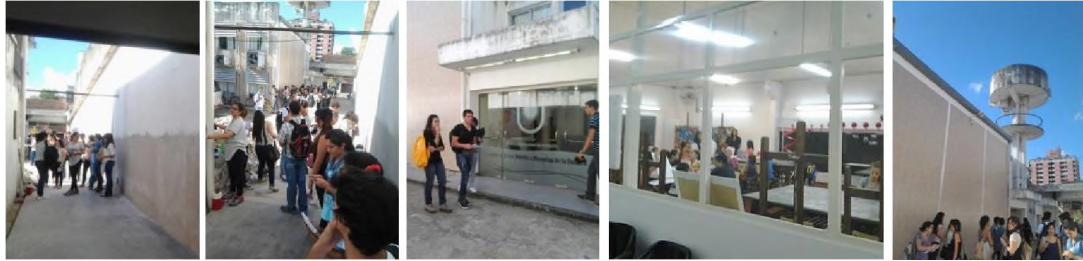
Imagen 5. Etapa Relevamiento CCN.

Los estudiantes entran en contacto con el problema y el sitio, midiéndolo, recorriéndolo, indagando y descubriendo disparadores para sus propuestas de diseño, acompañados por el equipo docente. Fotografían y croquizan el espacio y las situaciones de interés.