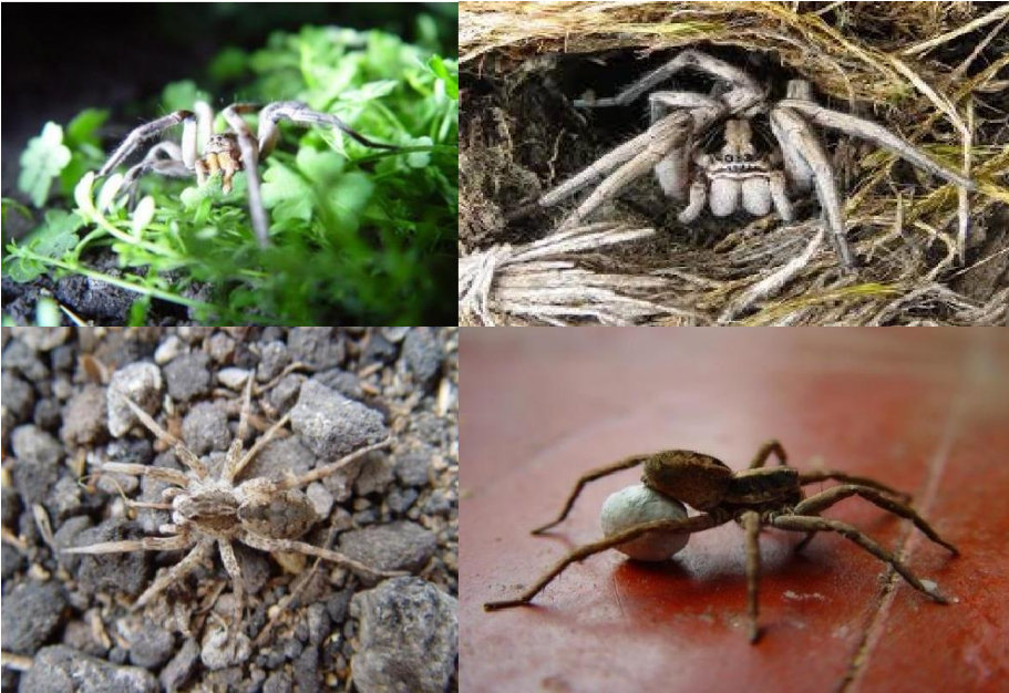
g: Diversidad de hábitats en los que se las suele encontrar, sobre vegetación, en el suelo, en dunas, suelos pedregosos y ambientes sinantrópicos.