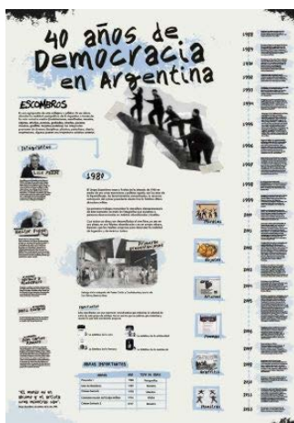
Figura 3. Escombro.