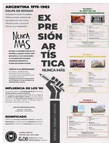
Figura 4. Nunca más. Fuente: Pérez Tuero y Por-tillo (diciembre de 2023).

maron la sociedad argentina y aportaron nuevos sentidos en la construcción de su memoria. Esto fue particularmente visible en los análisis de grupos de rock, en el cine o en la imagen gráfica, que permitieron comunicar aspectos silenciados en las narrativas de la historia reciente, reafirmando el valor del trabajo desarrollado en el aula.