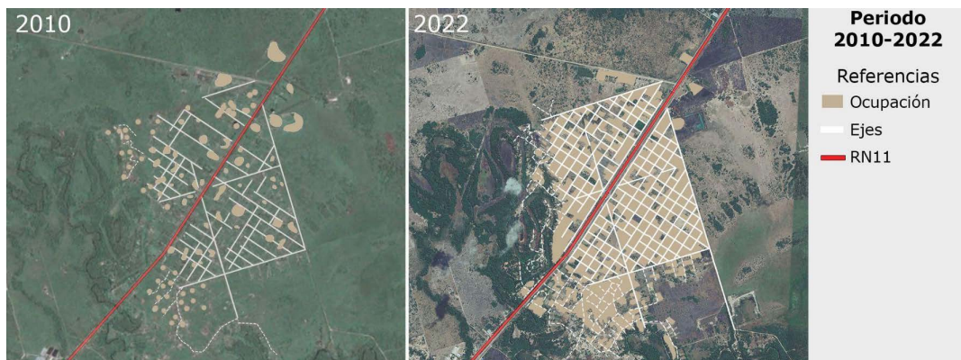
Figura 3. Expansión urbana de 2010 (a) y 2022 (b). Ampliación del ejido urbano.

un recorrido vehicular por la R11. Se observa cómo esta vía de circulación atraviesa la mancha urbana de Villa del Carmen, de esta forma partiendo su mancha urbana. A lo largo de su extensión se ven desarrolladas algunas actividades diversas, las cuales no guardan alguna relación entre sí, como las viviendas (actividad residencial) con estaciones de servicio (equipamiento de ruta) o galpones comerciales. Se aprecia cómo las personas residentes se movilizan desde el sector al área central, ya sea por trabajo, por estudio o incluso para la compra de algún producto en particular (fig. 4b); este tipo de flujo es constante no sólo con Villa del Carmen, sino que se repite con los otros sectores también incorporados.