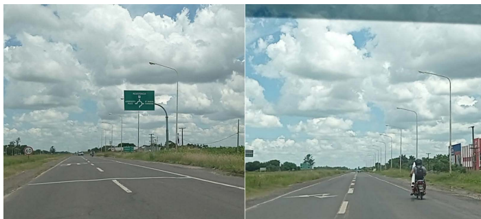
Figura 4. Recorrido por RN 11 antes de una rotonda (a) y 2022 (b). RN 11 con actividades en su lateral.

El Plan de Ordenamiento y Desarrollo Territorial de la ciudad de Formosa (POT For 2040), en la línea