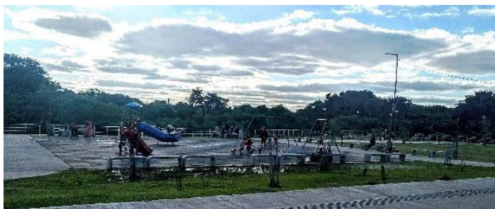
Figuras 3 y 4. A la izquierda, las viviendas del sector en estudio, próximas al paseo costero; a la derecha, el sector de juegos infantiles del mismo.

cho más relevante para garantizar el uso del espacio público por parte de todos es la diversidad, diversidad de funciones y de usuarios. La misma seguridad queda así de una manera o de otra garantizada" (BORJA Y MUXI, 2003, p. 93).