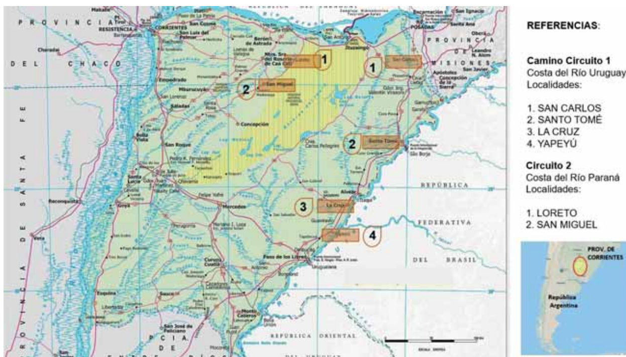
Figura 1. Circuitos del Camino de los Jesuitas. Circuito 1: Costa Río Uruguay; Circuito 2: Costa del Río Paraná.

El camino se desarrolla en circuitos y rutas, atendiendo a criterios de especialización y experiencia turística, y sobre la base del legado de los jesuitas y las poblaciones originarias de los países que lo configuran. Integra diecinueve recursos