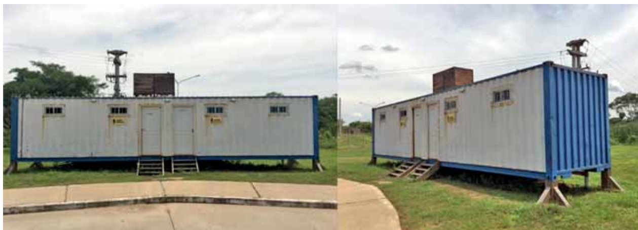
Figura 1. Sanitario existente del Parque de la Democracia.

puestos de venta de distinta índole (kioscos, florería, revistería), bicicleteros, locales de información turística, paradores de playa, baños públicos, sala de primeros auxilios, etc. Biera García (2017) menciona que el uso de los contenedores viene tomando fuerza en todo el mundo, donde su uso tiene una conexión poco común entre la eficiencia en la construcción, un ahorro económico y sostenibilidad, acompañado de un diseño moderno y elegante.