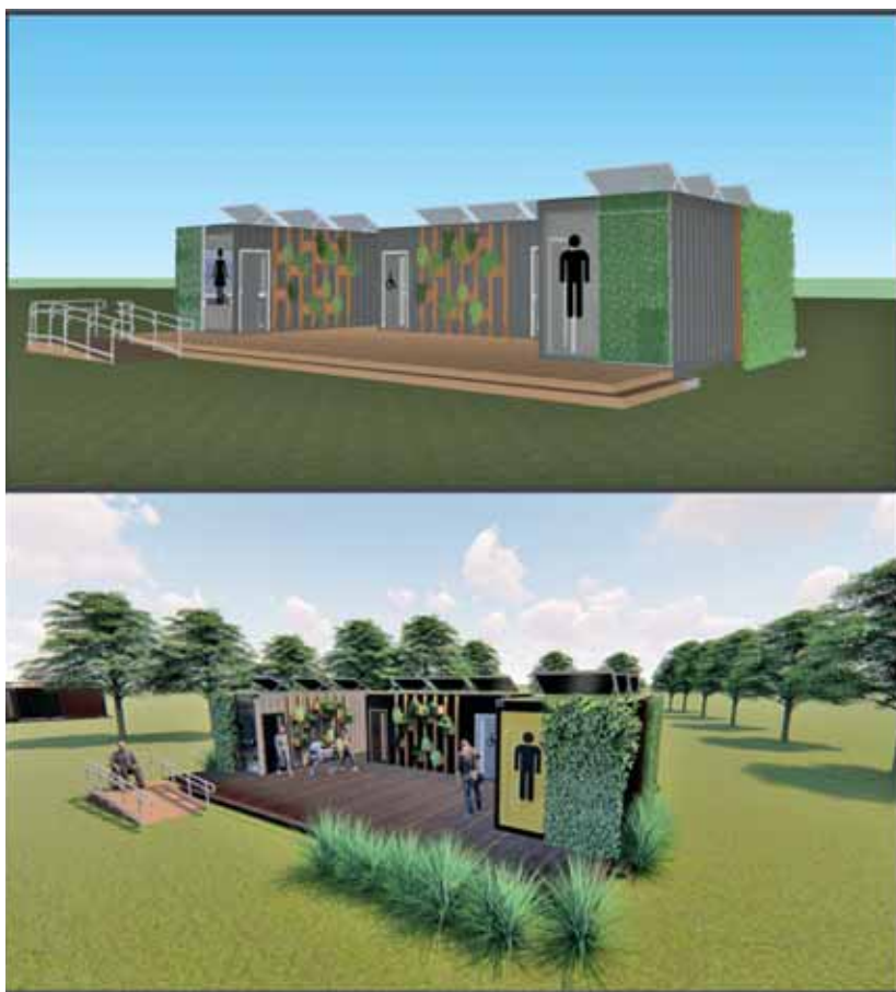
Figura 2. Propuesta de sanitarios para el Parque de la Democracia.

Al construir por medio de este método no convencional de reutilización de contenedores marítimos, se logran ventajas en muchos aspectos, como por ejemplo ahorros energéticos, materiales, operarios, tiempo de construcción, etc. La vida útil de un contenedor marítimo es de quince años, aproximadamente; una vez finalizado ese período el contenedor tiene tres opciones: se convierte en chatarra, lo vuelven a fundir para crear nuevos contenedores —lo que resulta ambientalmente favorable, pero poco conveniente desde el punto de vista económico— y por último —y de mayor interés en el contexto del presente trabajo— es lograr reutilizarlo para la construcción de distintos programas, entre los que se destaca para posibilidad de reúso como equipamiento urbano.