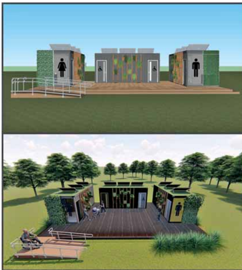
Figura 2. Propuesta de sanitarios para el Parque de la Democracia.

En la ciudad de Resistencia solo se identificaron, en el relevamiento realizado, pocos casos, correspondientes a baños públicos, depósitos y puestos de bicicletas, que carecen de buenas condiciones de calidad constructiva, ya que por lo general son contenedores aislados, sin contar con algún tipo de relación contextual a sus ubicaciones respecto de las condiciones climáticas, estéticas y ambientales.