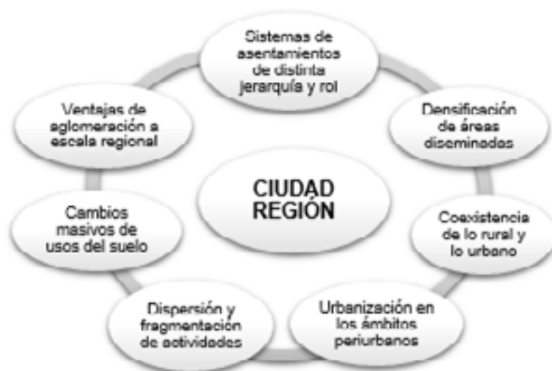
Figura N° 1. Rasgos esenciales de la Ciudad Región