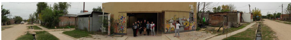
Fig. 5. Centro comunitario, referentes y entorno del Barrio Familias Unidas, Resistencia.

Durante el proceso se acudió a distintas instancias comunitarias de diagnóstico, propuesta y validación en cada una de las siete chacras donde se realizó la intervención, que decantaron en la Mesa de área sur, como instancia de representación de los vecinos para el acompañamiento del proyecto. A su vez, cada intervención territorial promovió la creación de espacios o mesas de participación comunitaria a escala barrial para acompañar la ejecución. Estos espacios introdujeron demandas propias y específicas. La Mesa de área se mantuvo muy activa especialmente durante la primera etapa, en la cual se constituyó como organización.