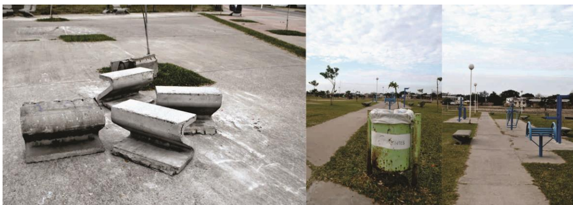
Fig. 8. Equipamiento en mal estado y vegetación deficitaria en el Eco Parque, Corrientes.

En el año 2010, una vez que se consiguió frenar ese proyecto, la Red propuso un espacio conjunto con el Municipio y el ámbito universitario para la realización del proyecto técnico y la mantención del predio de forma asociada. Luego del trabajo de diseño colectivo entre vecinos y técnicos municipales, el EcoParque Hipódromo se inauguró en el año 2011, aunque aún está pendiente su ampliación, mantenimiento adecuado y la gestión asociada.