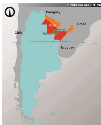
Fig. 1. Ubicación del sector en el país.