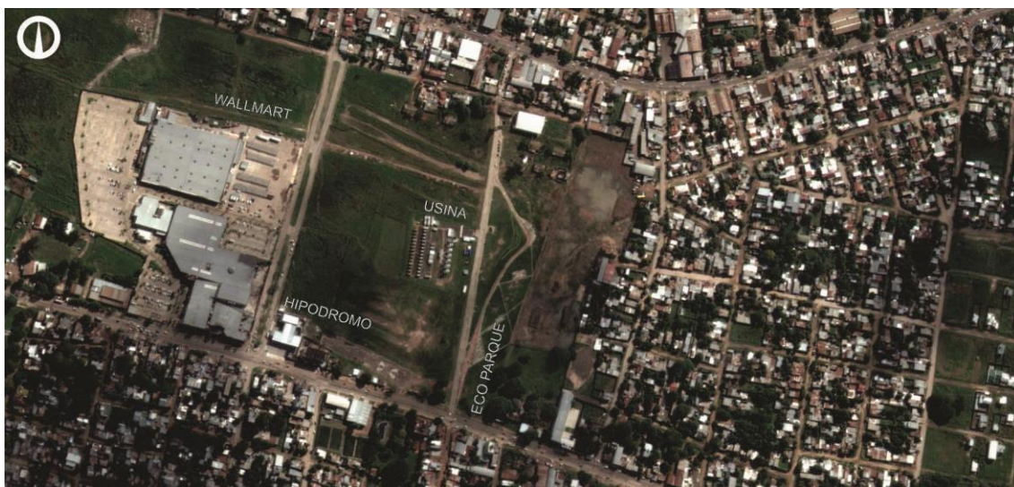
Fig. 7. Ubicación y entorno inmediato del Eco Parque, Corrientes.

La Red Vecinal Zona Norte congrega a organizaciones de diverso tipo, comisiones vecinales, referentes sociales, religiosos y vecinos independientes de 15 barrios de ese sector. Además del proyecto EcoParque, las demandas iniciales giraron en torno al mejoramiento de las principales arterias de circulación de la zona; implementación de presupuesto participativo y el fortalecimiento de Comisiones Vecinales.