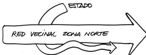
Fig. 9: Esquema proceso participativo Red Vecinal Zona Norte.

Luego de un proceso conflictivo en el que a nivel social se jugó la legitimidad de la demanda y se logró la visibilización del grupo, de la zona y del reclamo, se inició un trabajo de gestión participativa para el diseño y materialización del EcoParque. Finalizada esta instancia, el Municipio se retiró. Durante todo el proceso, la Red Vecinal marcó la prioridad de agenda en conseguir el objetivo propuesto, aunque fue desde el Estado municipal que se pautaron los plazos, presupuesto y dinámica de realización.