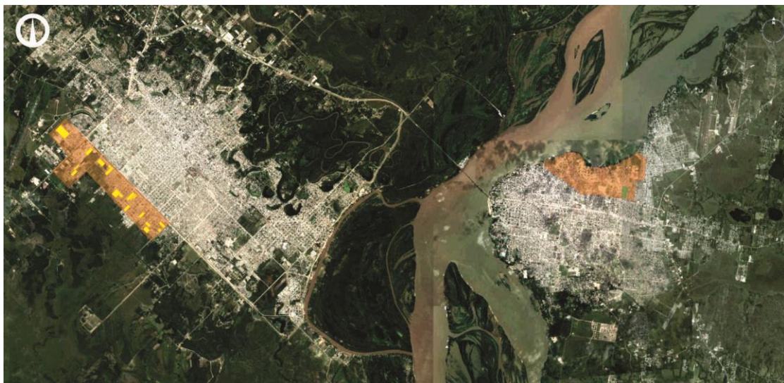
Fig. 2. Conglomerado urbano conformado por las ciudades capitalinas de Resistencia y Corrientes. Ubicación de los sectores analizados denominados Área Sur y Zona Norte, respectivamente.