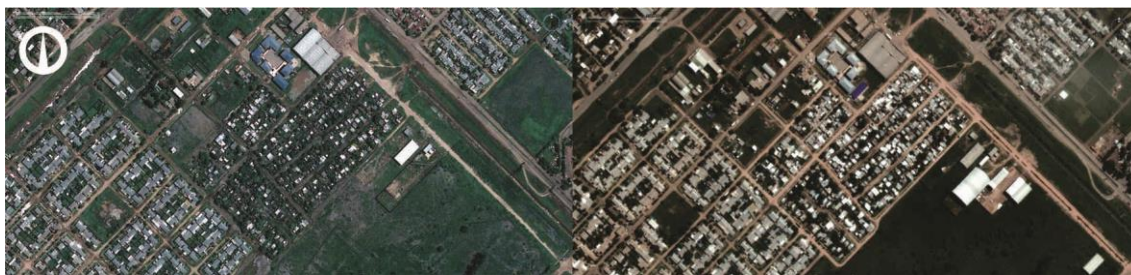
Fig. 4. Imágenes satelitales del año 2009 y del año 2016, luego de la intervención del programa, del sector conformado por los barrios Familias Unidas, Nueva Esperanza y Felipe Bittel del Área Sur, Resistencia.

La demanda que originó la intervención ha sido planteada históricamente desde amplios sectores sociales en cada uno de los asentamientos. Las problemáticas más comunes: precariedad habitacional, carencia de servicios básicos, de regularización dominial y de acceso a los terrenos.