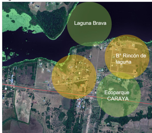
Figura 2- Área B2

Residencial Reserva Natural Laguna Brava / ecoparque