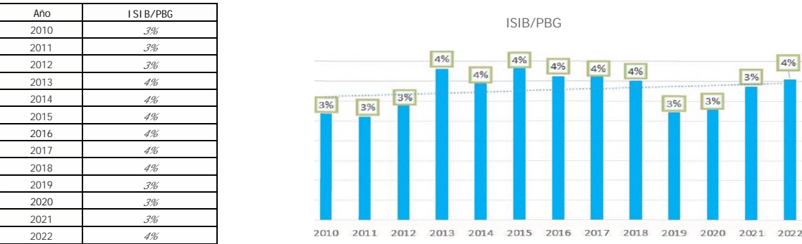
Gráfico 2 - Evolución del Impuesto sobre los Ingresos Brutos/ PBG

Fuente: Elaboración propia. Los datos de recaudación provienen de ATP. Los datos del PBG provienen del Instituto Provincial de Estadísticas y Ciencia de Datos.