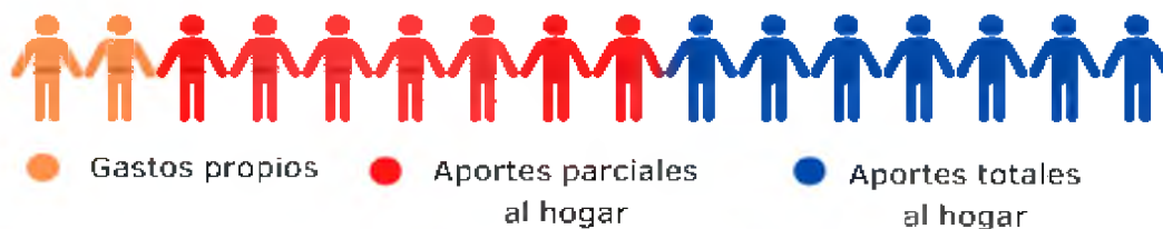
Gráfico 3: Principales destinos del ingreso salarial