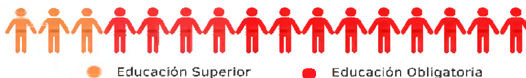
Gráfico 2: Máximo nivel educativo alcanzado