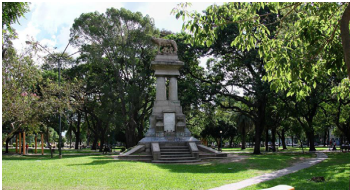
Monumento de la Loba Romana antes de su restauración. Plaza 25 de mayo de 1810. Resistencia. Chaco

en primera instancia. Para instalarse en el Chaco de les ofrecían lotes de 100 hectáreas, alojamiento, transporte y mantención por un año. 3