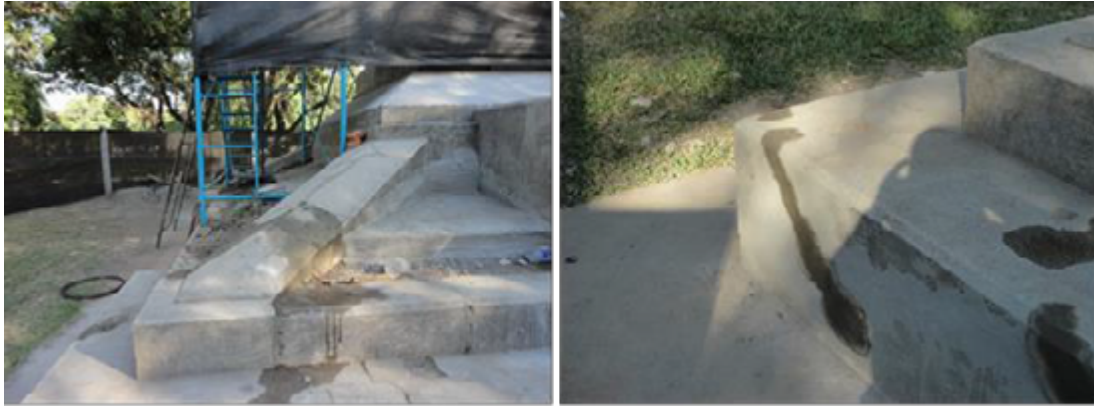
Pedestal. Colocación de llaves

resistencia a los agentes climáticos con flexibilidad y dureza superficial.