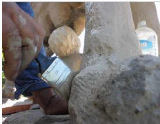
Limpieza de la escultura