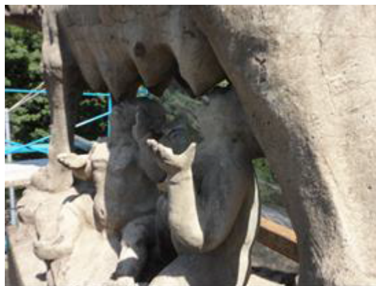
Escultura de la Loba. Detalles

Una loba, (Luperca), se acercó a beber y los recogió y