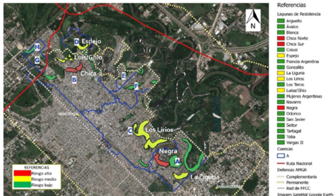
Figura 2. Clasificación de lagunas según viviendas en zonas de riesgo hídrico.

El Código Civil y Comercial establece como bienes de dominio público: