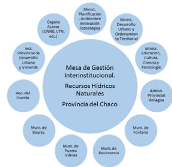
Figura 3. Propuesta de Modelo de la Mesa de Gestión Interinstitucional.

La concientización de la población del AMGR acerca de las condicionantes del territorio y cuidado requerido por el territorio natural, modificado permanentemente para configurarse en soporte de las actividades humanas, es una materia pen-