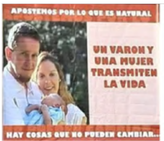
Posteo extraído de un grupo de Facebook

Por tanto el modo de decir que caracteriza al discurso religioso funciona como reflejo de lo establecido por la cultura dominante, la cual, en este caso, funda sus cimientos en los lineamientos propuestos por la “matriz heterosexual” (Soley-Beltrán, 2009:36). Aquel “modelos discursivo/epistémico que distribuye a los individuos en clases convencionales de similitud « hombre/mujer, chico/chica, adolescente, desviados», etc”. (Soley-Beltrán, 2009:105) y desde donde se impone determinadas “normas de identidad” “. (Soley-Beltrán, 2009:44) que configuran el paradigma de esta cultura propia del semiosfera religiosa la cual se ve reflejada en discursos como los expuestos a continuación.