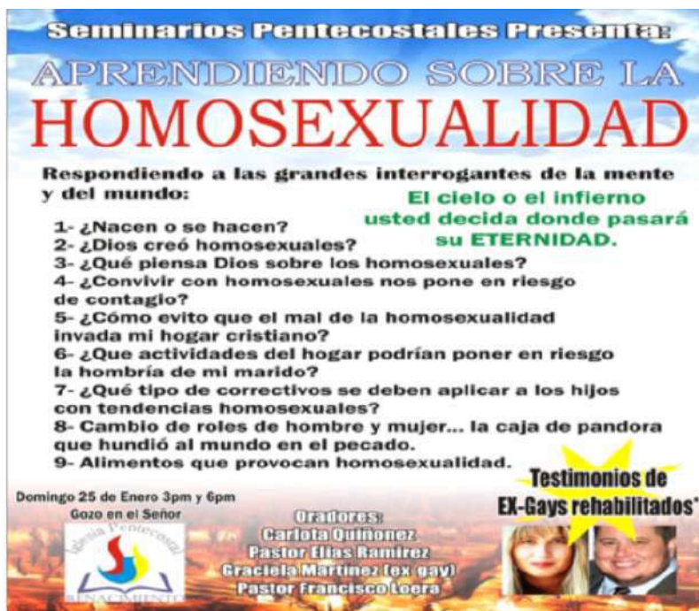
Imagen extraída de un grupo de Facebook Evangelista

A continuación se expone una imagen extraída de un grupo de Facebook evangelista que permite establecer semejanzas y diferencias con la anterior respecto al modo en que se construye discursivamente al homosexual