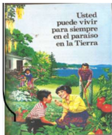
Folletto repartido por un grupo de evangelistas

Tanto el folletto como el posteo de Facebook muestran al hombre y a la mujer como los únicos elementos aceptables para conformar una familia según lo establece Dios. Por tanto lo