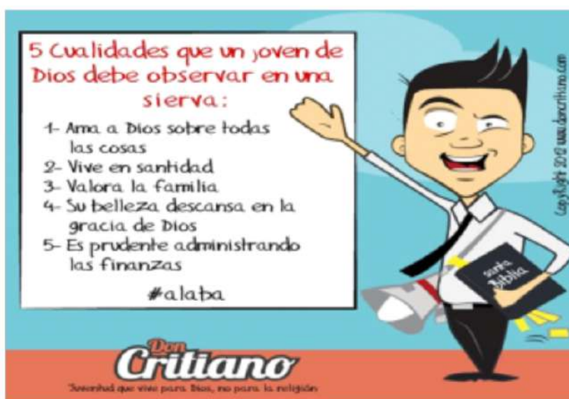
Posteo extraído de un grupo de Facebook evangelista-abierto

Por tanto, a través de estos modos de decir es que el discurso religioso comunica lo considerado aceptable dentro de la semiosfera religiosa, la cual al igual que todo “espacio de sentido tiene sus correspondientes habitantes” (Lotman, 1996: 84) puesto que esto garantiza la presencia de sujetos convencidos de lo que comunica.