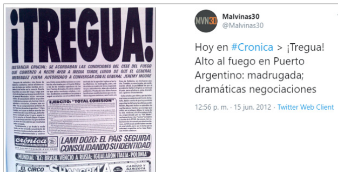
Figura 2. Publicación del diario Crónica sobre la situación crítica en Malvinas.