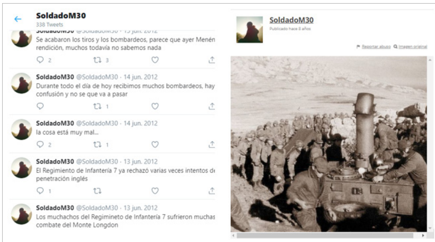
Figura 1. Ejemplo de relato en primera persona de recreación del conflicto bélico. También se planificó el uso de un sitio para el registro de imágenes que reflejan el escenario en Malvinas.

Remarcando el interés de la temática abordada y la planificación comunicacional transmedia, a continuación, se realizará una descripción de los documentales transmedia, para luego proceder al análisis valiéndonos de conceptos referenciales de diferentes autores que abordan la temática.