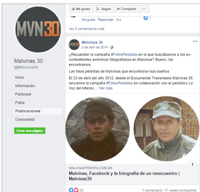
Figura 6. Publicación en Facebook del perfil Malvinas 30. Campaña para recuperar fotos perdidas en articulación con el diario la Voz del Interior . Los resultados fueron positivos y permitió obtener documentación a raíz de la planificación.

En las diferentes piezas comunicacionales recuperadas se identifica una narrativa principal; adquiere relevancia el relato en primera persona, a la vez que la interactividad que se produce permite reunir documentación que retroalimenta la reconstrucción de un hecho histórico para el país. La documentación se transforma en pruebas valiosas, que a la vez, mantienen una estrecha relación en la construcción de las narrativas que se recrean, guardando interdependencia y complementariedad con el relato. De este modo, el documental que se ejecutó con una continua producción de cuatro meses, logró extender el relato a través de distintas plataformas digitales. Así se sensibilizó a los usuarios para que revivan la Guerra de Malvinas en distintos escenarios, que a modo ilustrativo en el presente trabajo se reconstruyó uno de los aspectos tan caros para la historia argentina.