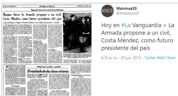
Figura 5. Publicación del diario español La Vanguardia que recoge la Propuesta de continuar en el poder del gobierno militar, en la persona del Embajador Costa Méndez.