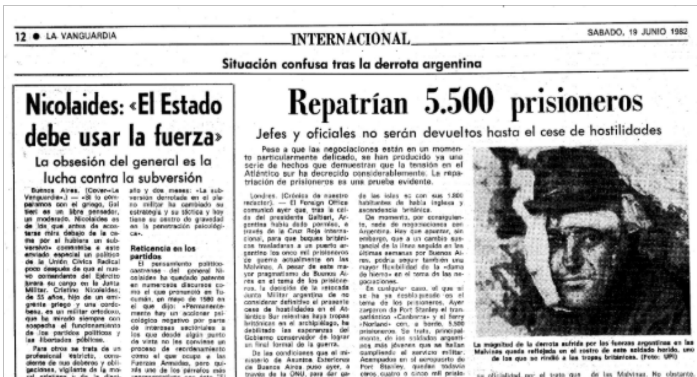
Figura 3. Publicación del diario español La Vanguardia que describe el escenario después de la derrota Argentina en Malvinas.

Con la finalidad de identificar las características de la construcción narrativa en diferentes plataformas, se seleccionó información encontrada en los sitios que reflejan los acontecimientos trascendentes en la guerra de Malvinas. Con los datos de referencia se intenta describir una etapa que nos tocó vivir.