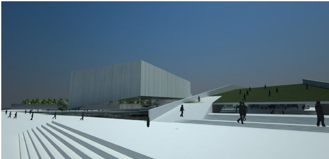
Figura 5. Palacio Legislativo, Imagen de Concurso. Primer Premio 2009.

La localización de edificios públicos de gran relevancia en el tejido urbano afecta de forma significativa en la estructura urbana y el crecimiento de la ciudad, no se trata de construcciones enchufe que se ubican indistintamente en la trama urbana, no es indiferente al funcionamiento de la ciudad y una equivocada decisión genera problemas de gestión de suelo y de edificación desbaratando la posible planificación urbana tan necesaria en nuestra ciudad.