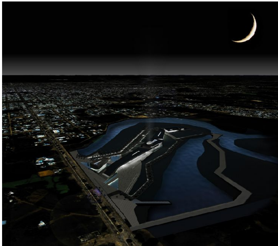
Figura 1. Palacio Legislativo, Imagen de Concurso. Primer Premio 2009.

Recordemos que llegar a esta instancia casi decisiva, realizada por Ley N°7925 y su modificatoria Ley N°7970, fue resultado de un extenso y costoso derrotero en los últimos 40 años de realizar varios proyectos y hasta un tercer concurso para el mismo equipamiento estatal, en cinco emplazamientos distintos, incluyendo el proyecto plagiado por parte de técnicos estatales, sin contar los dos proyectos de Ciudad Cívica que también lo incluían, de uno de los poderes del estado que aún no tiene sede propia desde que sesiona (el 4 de junio de 1953) hace 66 años.