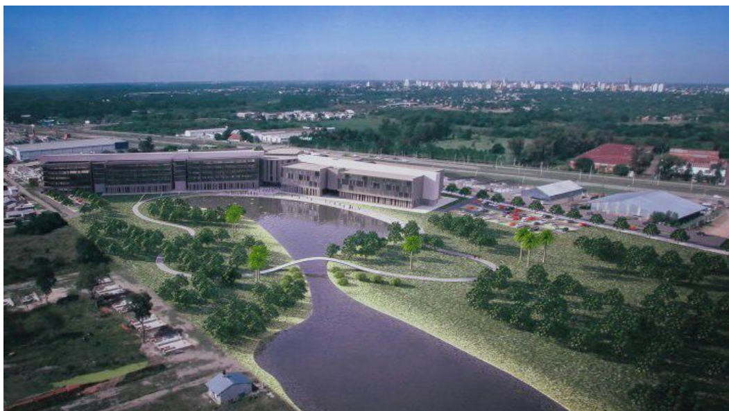
Figura 2. Palacio Legislativo, Imagen de Concurso. Primer Premio 2017. Localización Zona Logística Industrial.