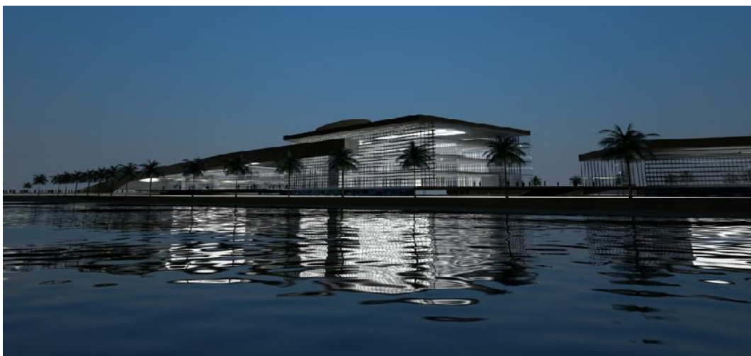
Figura 7. Palacio Legislativo, Imagen de Concurso. Primer Premio 2009.

Entonces ¿Cuál es la inmediatez que nos lleva a elegir un vacío remanente y muy mal localizado para el edificio más significativo que se construirá este siglo en la ciudad? ¿Cuál es el apuro por ubicar un edificio del 2008 más de diez años después sin la ineludible 8 planificación?