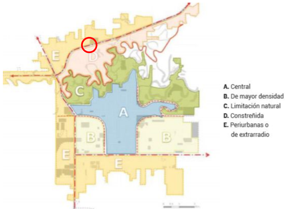
Figura 4. Zonas con déficit de conectividad recíproca.