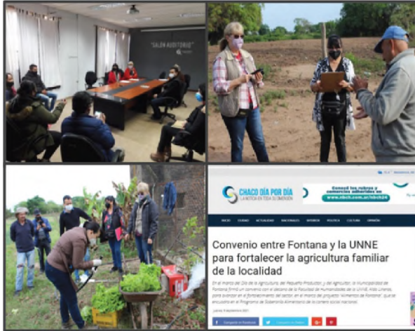
Figuras 3 y 4. Entrevistas, reuniones de trabajo e intervención con los Sujetos de la AFU-Fontana