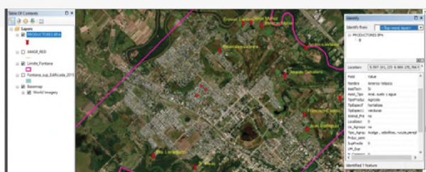
Figura 2. Localización geográfica de parcelas y productores familiares con SIG

b. Reconocimiento del Territorio (actores y lugares) y localización geográfica de las explotaciones. (Figura 2)