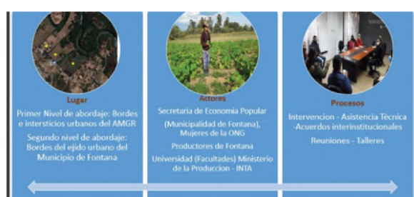
Figura 1. Componentes de la Tríada Social en la AFU del AMGR

a. Contribución a la discusión teórica referida a la agricultura familiar (AF) destacando conceptos, elementos y aspectos que resultaron importantes trabajar, a saber: bordes e intersticios urbanos y componentes de la tríada social (lugares, actores y procesos) observados hasta el momento. (Figura 1)