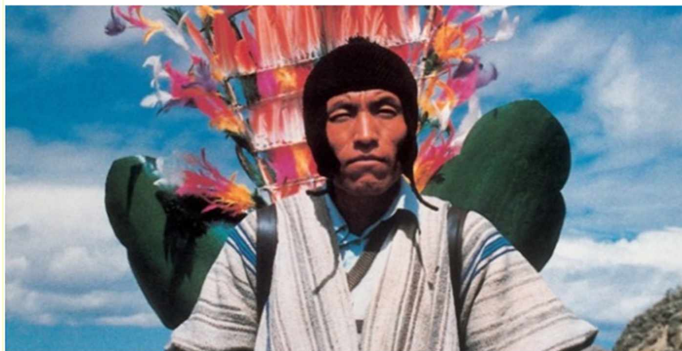
Ilustración: portada de la película "La Nación clandestina" de Jorge Sanjines.

El plan de trabajo de la beca de grado, al enmarcarse en la línea de investigación del GID del que integro, posee parte de su metodología de trabajo. Para su desarrollo, se recurrió a la selección de material bibliográfico de autores provenientes del campo de las Ciencias Sociales y así como autores que adoptan la perspectiva del pluralismo jurídico, desde donde se desarrollará la cuestión mencionada.